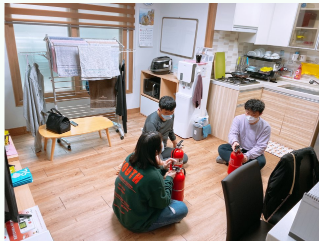
▲ 소화기 사용법을 익히는 다형 입주자분들

3월 4일(수) 다형 장애인자립생활주택에서 소방안전교육 프로그램을 진행하였습니다.