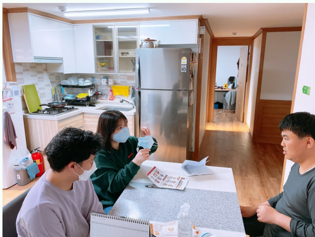
▲ 소방안전교육을 듣는 다형 입주자분들