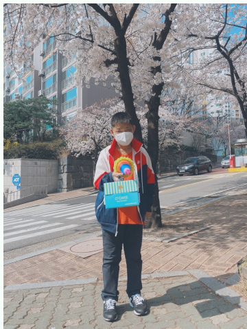
▲ 생일선물을 자랑하는 모습