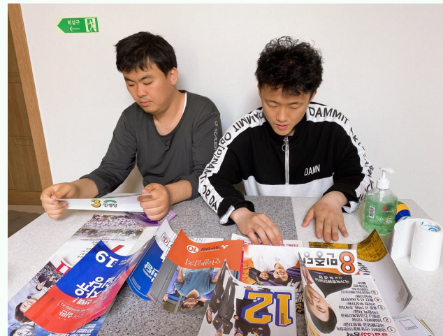
▲ 후보자들을 살펴보고 있는 다형 입주자들

4월 10일(금) 다형장애인자립생활주택에서 자기권리 옹호훈련 교육프로그램을 진행하였습니다.