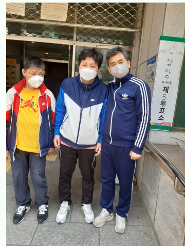
▲ 투표 예행연습을 진행하는 가형 입주자분들