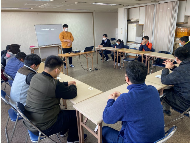
▲ 2차 자조모임 사전회의 진행 모습