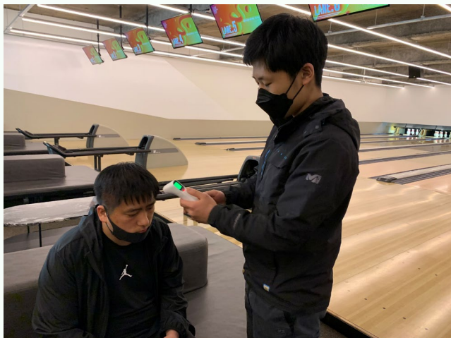
▲ 체험 전 체온체크 하는 모습