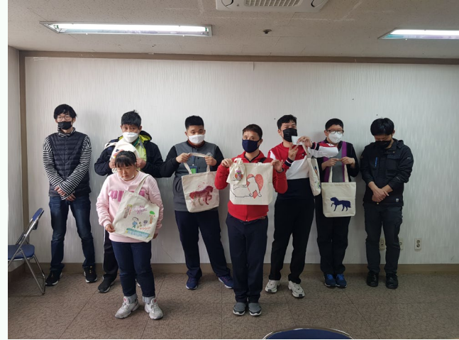
▲ 발달장애인 자조모임 에코백 꾸미기 단체사진

4월 22일(수) 강북장애인자립생활센터 가든타워 17층 1707호 교육실에서 2차 발달장애인 자조모임 에코백 꾸미기를 진행하였습니다.