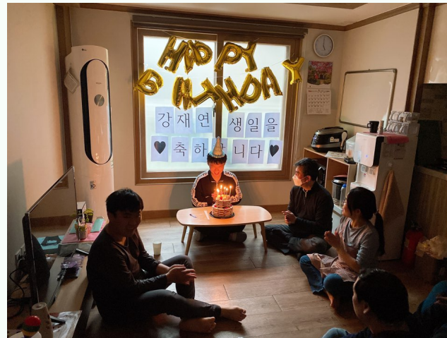
▲ 다 함께 강00씨에 생일을 축하하는 모습

4월 10일(금) 다형장애인자립생활주택에서 요리실습과 생일파티 프로그램을 진행하였습니다.