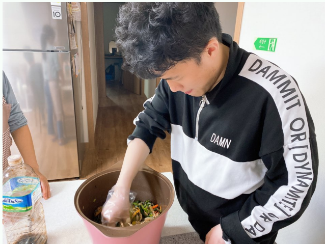
▲ 잡채를 버무리고 있는 입주자 강00씨