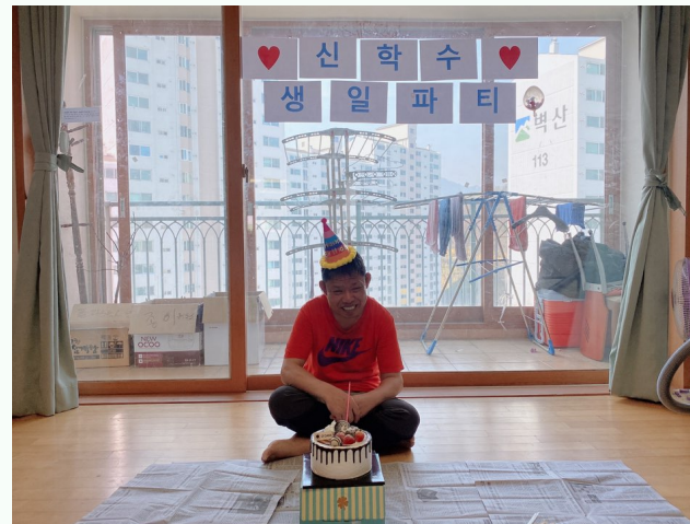
▲ 신00씨 생일파티 진행 모습

장애인자립생활주택 가형 주택 생일파티 프로그램은 4월 3일(금) 가형 주택에서 진행 되었습니다.