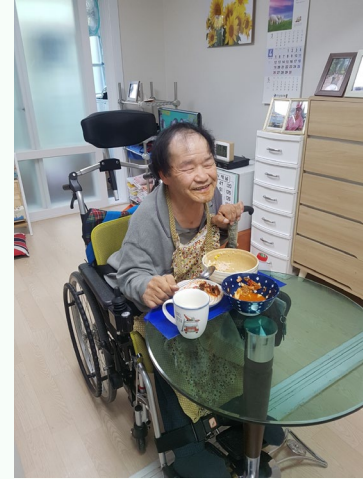
▲ 미소를 지으며 자신의 집을 자랑하는 김00씨

3월 26일(목)가형 입주자 김00씨께서 좋은 기회를 통해서 생애 처음으로 자신만의 집을 갖고 자립을 하게 되었습니다.