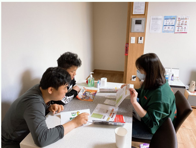
▲ 투표에 대한 설명을 듣는 다형 입주자들