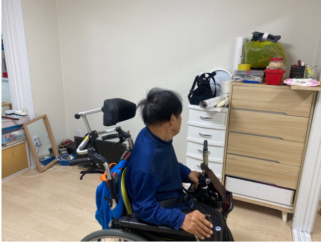
▲ 집을 둘러보는 김00씨