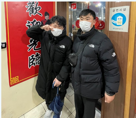
▲ 맛있는 음식을 먹기전에 사진 찰칵