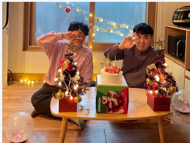
▲ 크리스마스 파티는 정말 즐겁습니다.

2021년 12월 24일(금) 다형 장애인자립생활주택 여가문화체험 프로그램 『크리스마스 파티』이 진행되었습니다.