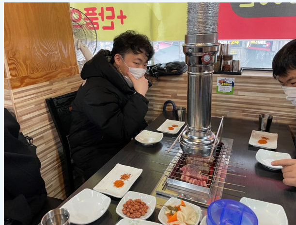
▲ 양꼬치 정말 기대됩니다!

2021년 12월 15일(수) 다형 장애인자립생활주택 외식문화체험 프로그램이 진행되었습니다.