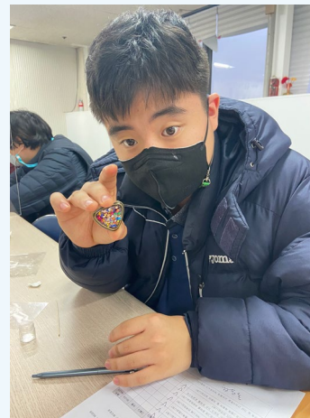
▲ 반짝반짝 빛나는 브로치를 만들었어요.

5차 집단 ILP 레진공예 체험 프로그램이 11월 30일 화요일에 진행되었습니다~