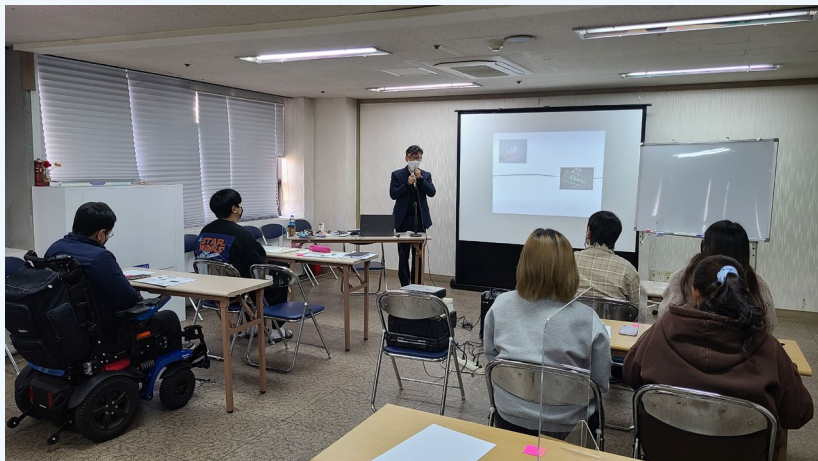
▲ 센터돌보기 진행 사진