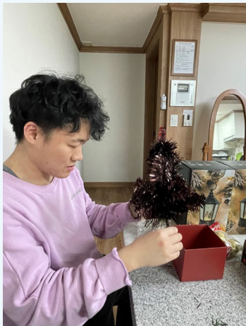
▲ 크리스마스 트리를 꾸며보아요~