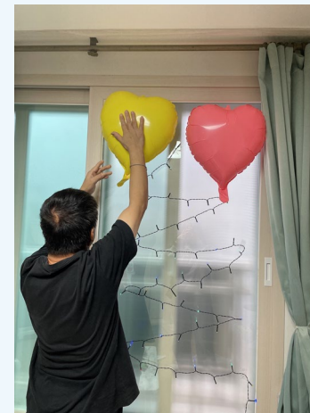
▲ 크리스마스 분위기로 단장하고 있어요!~