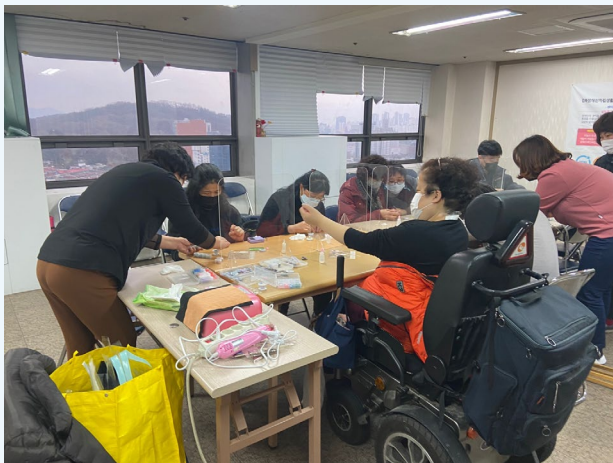
▲ 만들기에 열중해 볼까요?