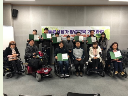
▲ 기초과정 수료식 단체사진

강북센터에서는 3월 11일부터 13일까지 2박 3일 동안 대방동 여성플라자에서 동료상담가 양성교육 기초과정 ‘너의 보석돌이 되어줄게’를 진행하였습니다.