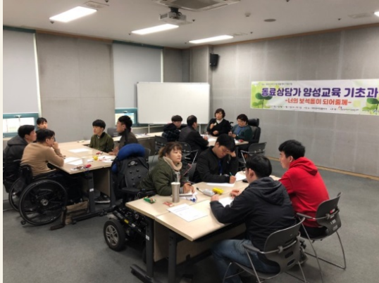
▲ 역할극을 하기 위한 조별 회의 모습