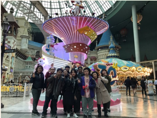
▲ 2차 발달장애인 자조모임 놀이동산체험 단체사진

3월 13일(수) 발달장애인 자조모임 ‘어울림’ 2차 사전회의를 진행하였습니다. 송○○씨의 진행으로 2차 사전회의가 시작되었고 ‘2차 자조모임 프로그램으로 무엇을 하면 좋을까?’라는 안건으로 회의를 행하였으며, 그 결과 놀이동산에 가고 싶다는 의견이 많아 회원들의 의견에 따라 2차 자조모임은 롯데월드 놀이동산 체험으로 결정하였습니다. 다음 안건으로 ‘밥은 무엇을 먹으면 좋을까?’라는 안건으로 투표를 진행하였으며, 여러 가지 메뉴들 중에 제일 많은 표가 나온 햄버거를 먹기로 하였습니다.