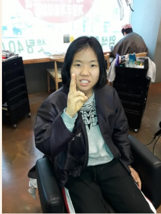
▲안○○씨 1차 개별ILP 원하는 머리스타일 해보기