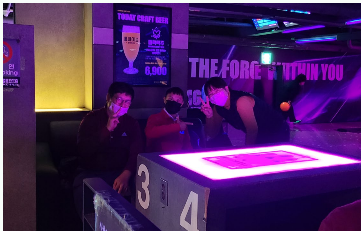
▲ 자신의 차례를 기다리며 다함께 찰칵!