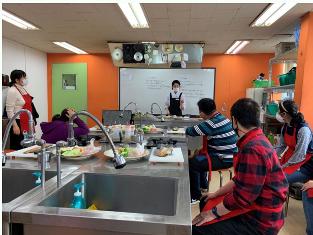
▲ 요리강사님에게 조리법 설명을 듣고 있는 모습