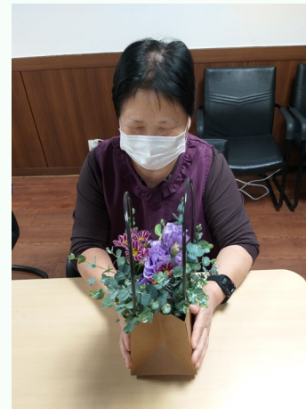
▲ 즐거운 꽃꽂이 허○○ 어르신

10월 대리원에서는 참여자들의 다양각색 원하는 프로그램을 진행하고자 물품을 지원해 드립니다.