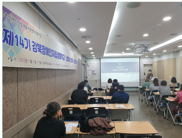
▲ 2강 '지역사회 내 자립생활센터의 역할' 강의진행 모습

제14기 강북장애인자립생활학교는 총 6강의로 구성되어 있으며, 첫 강의로 대구대학교 대학원 장애학과 조한진 교수님의 '탈 시설과 인권'을 10월 21일(수)에 이룸센터 소교육실 2층에서 진행하였습니다.