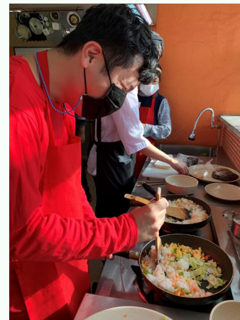
▲ 볶음밥 재료를 직접 볶아보는 모습

강사님에 시연이 끝난 뒤 참여자분들께서도 조리를 시작하였고 첫 번째로 칼을 사용하여 양파, 피망, 당근, 애호박 등을 손질 후 후라이 팬에 새우와 함께 볶은 다음에 밥을 추가하여 맛있는 새우 볶음밥을 완성하였습니다.