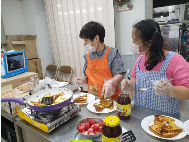
▲ 화상통화를 이용하여 프로그램 진행 중인 참여자들 모습