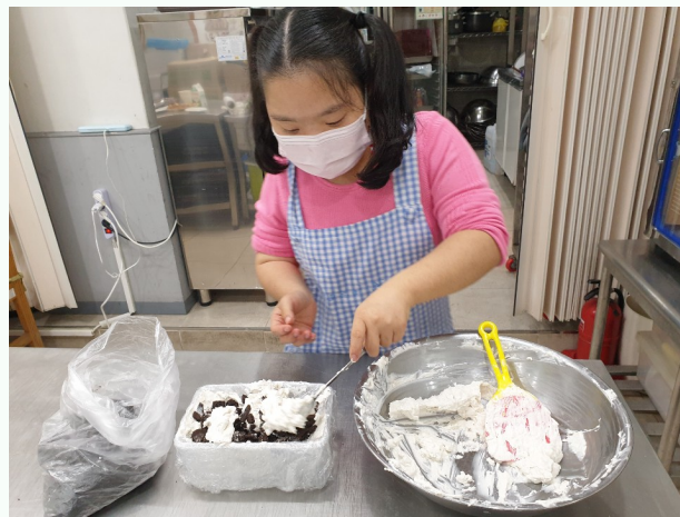
▲ 맛있는 오레오 아이스박스를 만들어보는 모습

저도, 참여자분들도 화상통화로 프로그램을 진행한 것은 처음이라 낯설기도 했지만 그래도 다른 공간에서 함께 프로그램을 할 수 있다는 생각에 매우 설레고 즐거웠습니다.