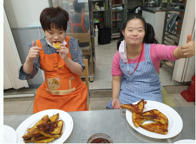
▲ 완성한 디저트 시식

10월 26일(월) / 10월 27일(화)에 이○○씨, 전○○씨의 4 ~ 5차 개별 ILP '디저트 만들기'를 진행하였습니다.