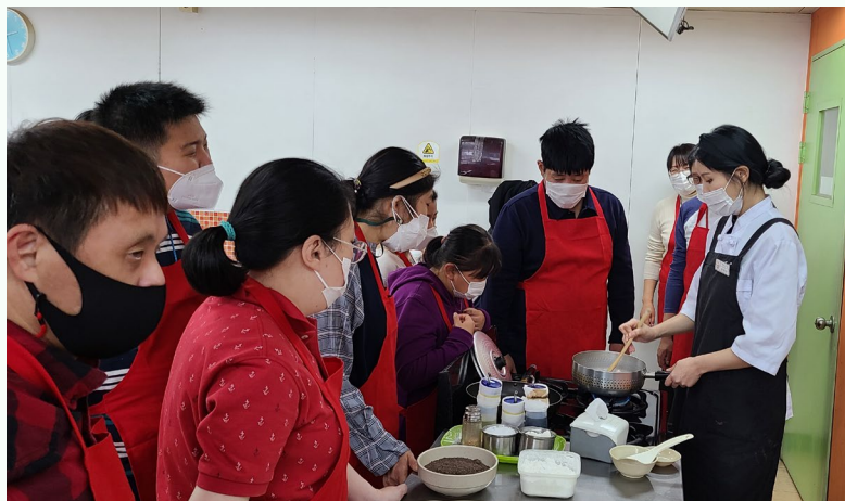
▲ 강사님께서 조리하는 모습을 지켜보는 참여자들