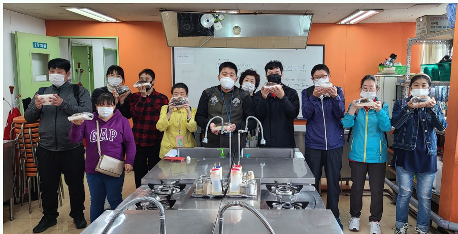
▲ 자조모임 '어울림' 요리교실단체사진

7차 발달장애인 자조모임 '어울림' 은 10월 14일(수) 13시 수유역 2번 출구에 모여 체온 체크를 진행하여 호흡기 증상 여부를 확인하고 점심식사 장소로 이동하였습니다.