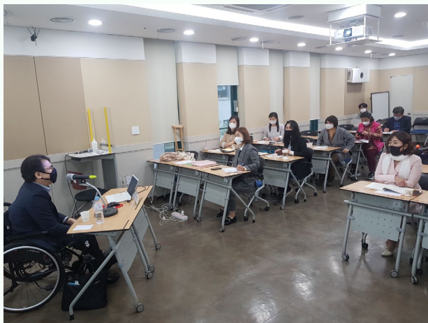
▲ 1강 '탈시설과 인권' 강의진행 모습