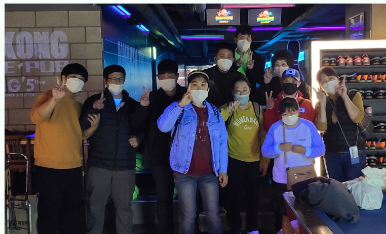
▲ 자조모임 ‘어울림’ 볼링체험 단체사진

10월 28일(수) 발달장애인 자조모임 어울림’ 은 8차 볼링체험을 위해 수유역 2번 출구에서 참여자들과 만나 체온 체크 후 점심식사 장소로 이동하였습니다.