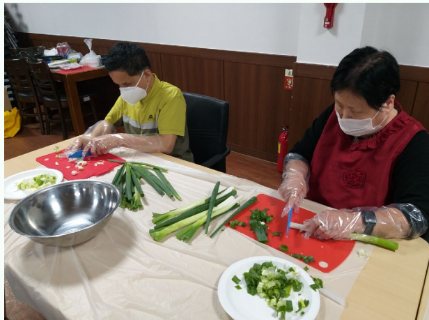
▲ 집단 ILP 궁중떡볶이 만들기