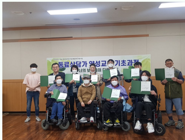
▲ 동료상담가 양성교육 기초과정 수료식 진행 모습

5월 13일(수) ~ 5월 15일(금) 서울여성플라자에서 동료상담가 양성교육 기초과정을 진행하였습니다.