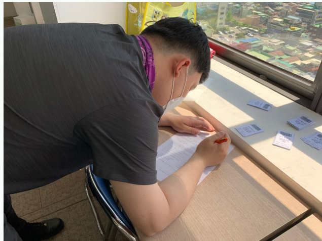
▲ 만족도 조사지 작성 중인 체험자