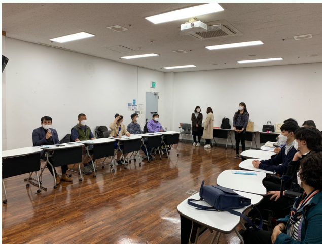
▲ 동료상담가 양성교육 기초과정 진행 모습