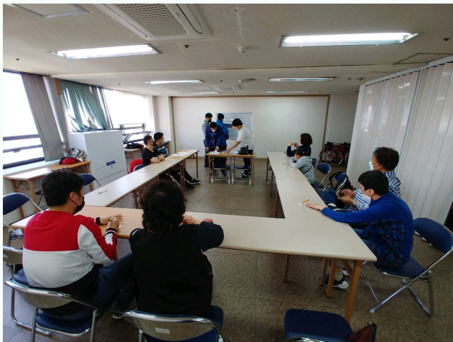
▲ 3차 자조모임 사전회의 진행 모습