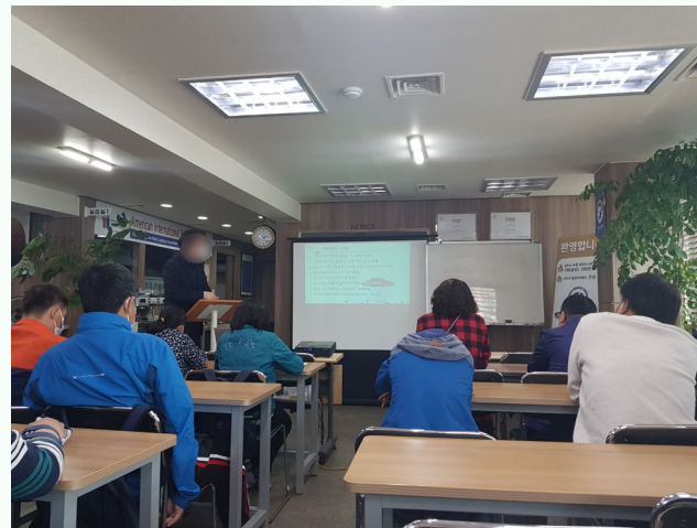
▲ 발달장애인 자조모임 바리스타 체험 교육 진행 모습

5월 13일(수) 발달장애인 자조모임 ‘어울림’ 3차 사전회의를 강북센터 교육실(1707호)에서 진행하였습니다.