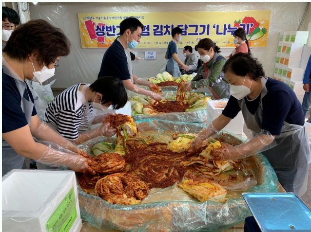
▲ 김치담그기 체험 중인 체험자들