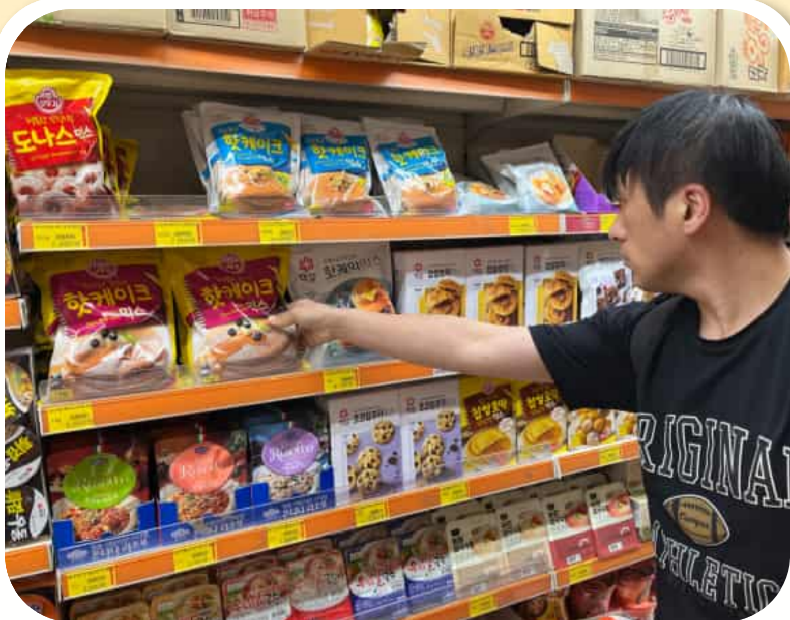
요리 재료를 구매하는 임*진님