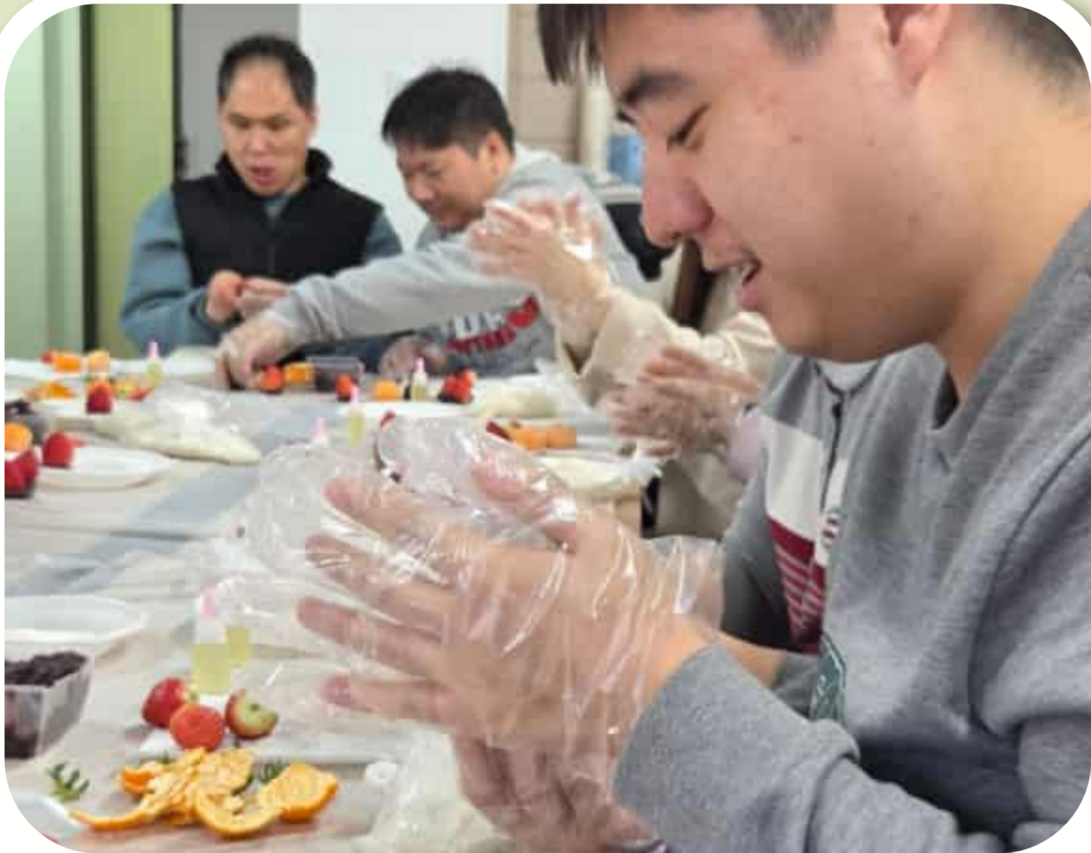
과일참쌀떡을 만들고 있는 참여자