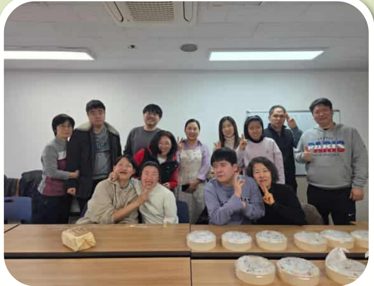
1차 발달장애인 자조모임 단체사진

2026년 2월 25일 (수) 1차 발달장애인 자조모임으로 '과일참쌀떡' 만들기 체험을 진행하였습니다. 참여자분들의 집중하는 모습을 볼 수 있었습니다.