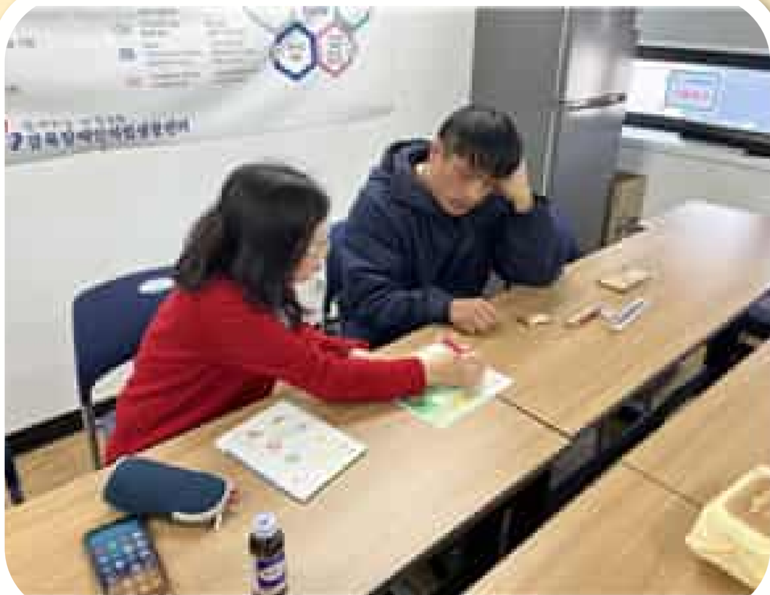
학습 중인 임*진님