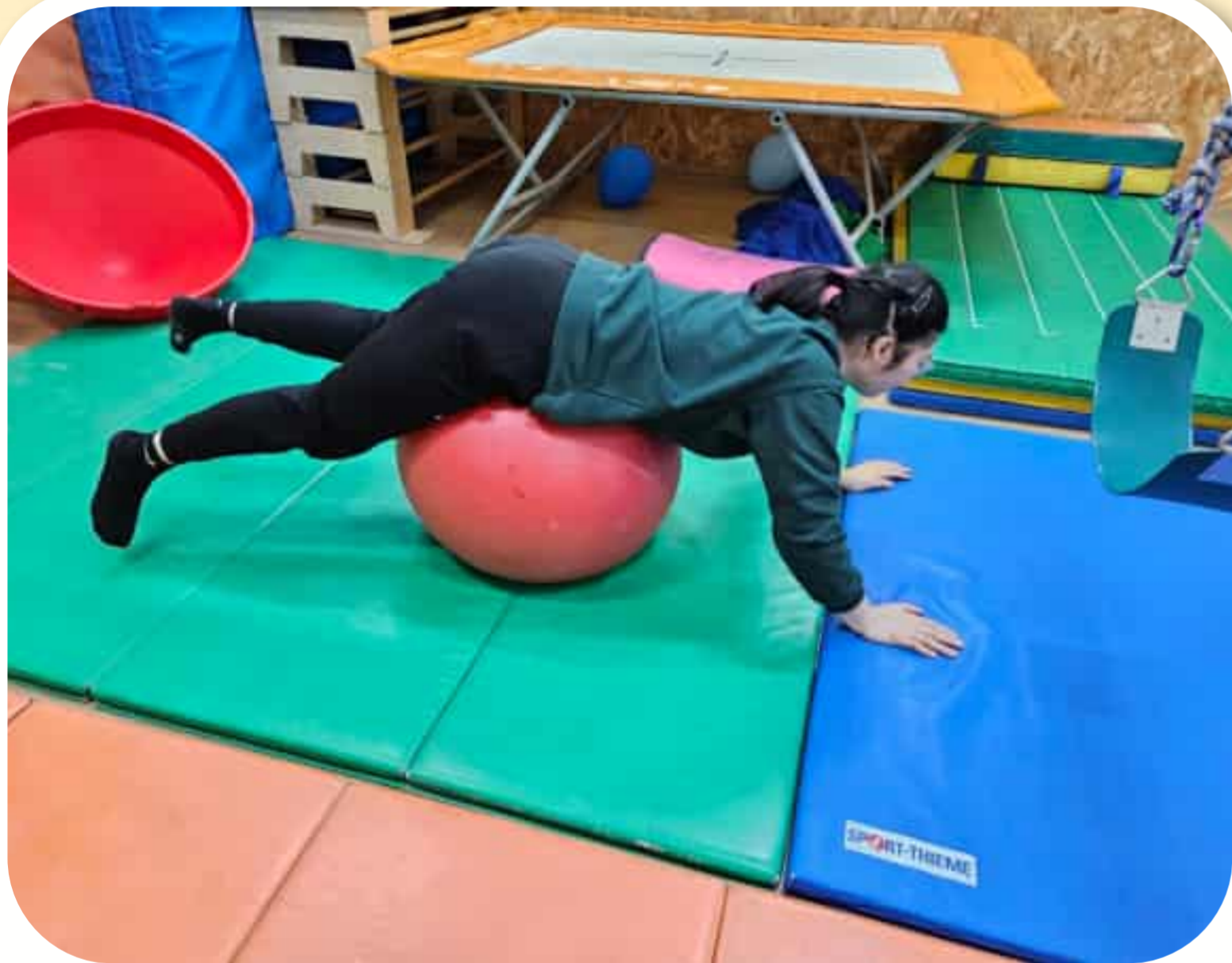
체중감량 운동 진행 중인 문*아님