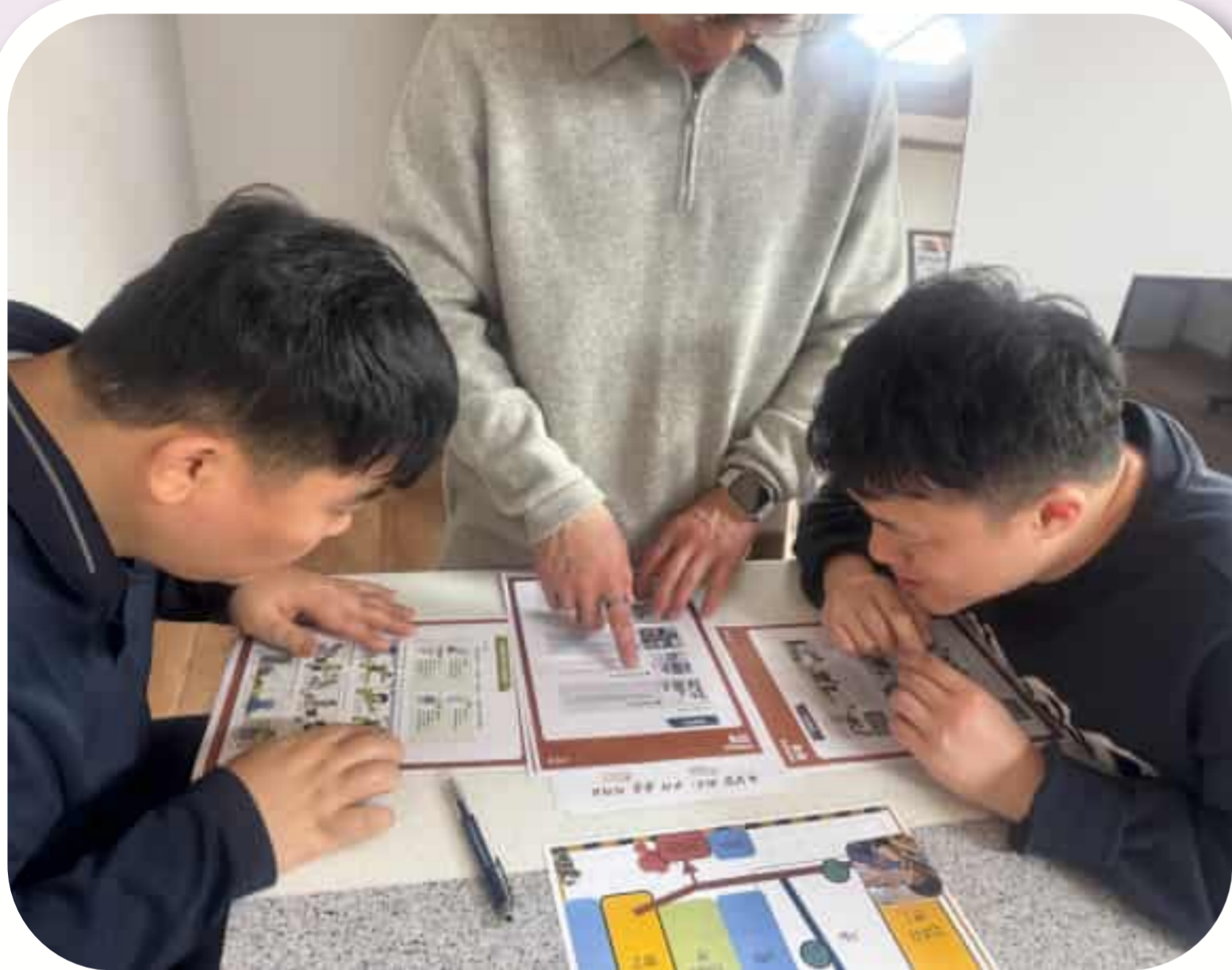
퀴즈를 풀어보는 입주자들