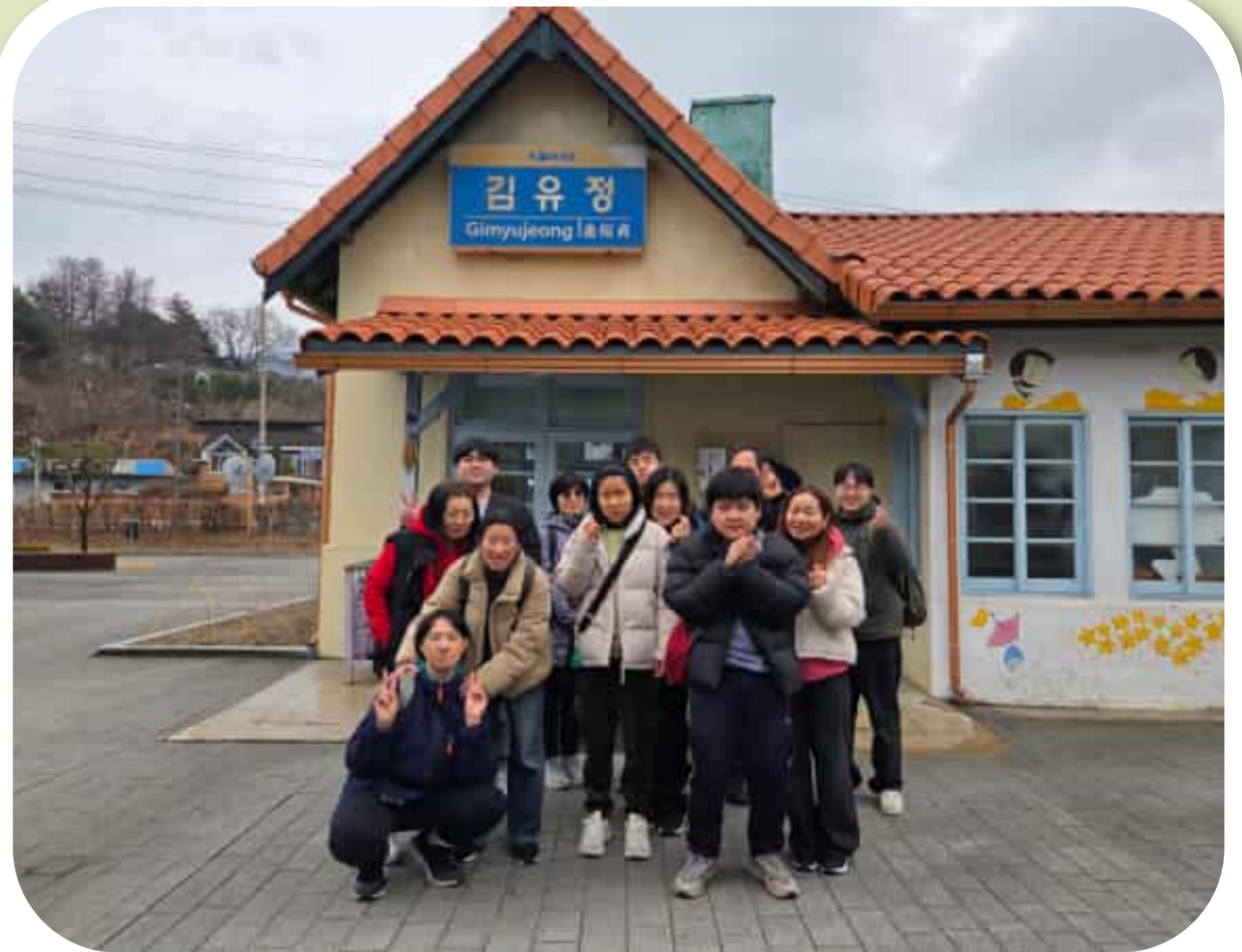
2차 발달장애인 자조모임 단체사진

2026년 3월 18일 (수) 2차 발달장애인 자조모임으로 '기차 여행' 을 진행 하였습니다. 박물관 관람, 폐역 관람, 도장 만들기 체험을 진행하였으며 새로운 경험에 재밌어하는 모습을 볼 수 있었습니다.