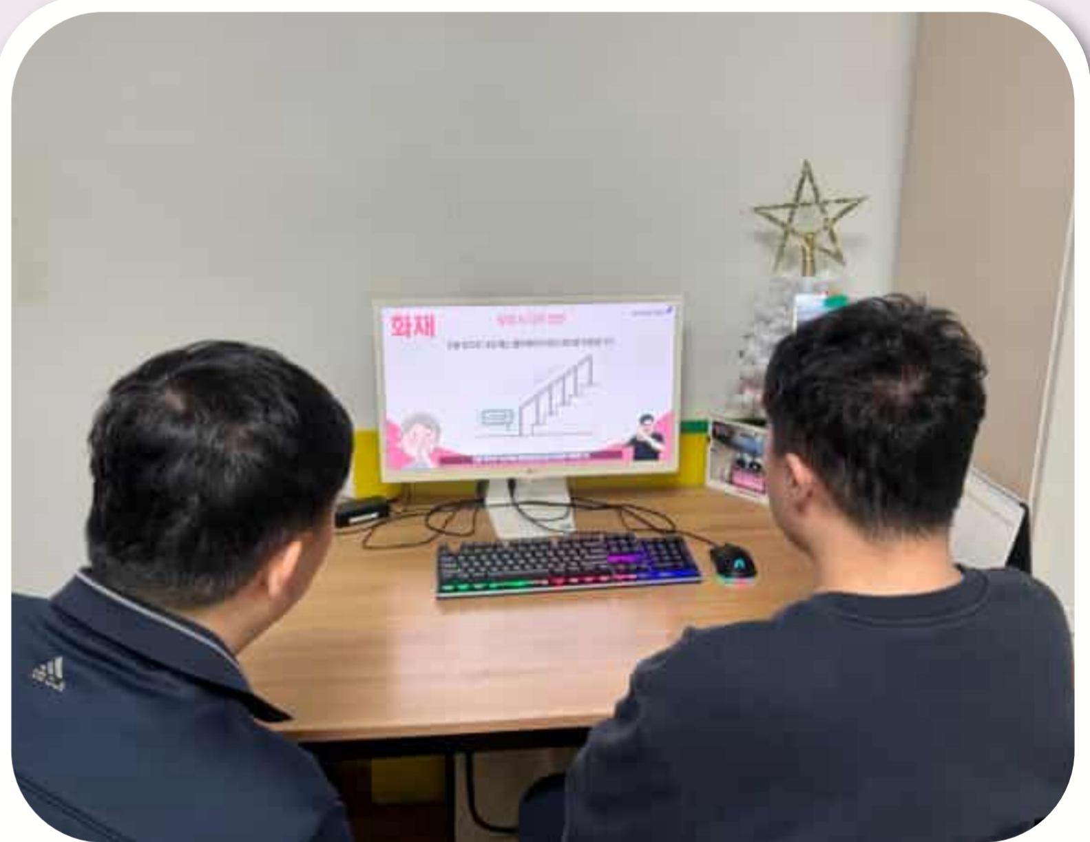
소방안전교육을 듣는 입주자들

2026년 2월 24일 (수) 1분기 소방안전교육을 진행하였습니다. 화재 시 대피방법, 소화기 방법 등 효과적인 화재 대피 훈련을 진행하 였습니다.