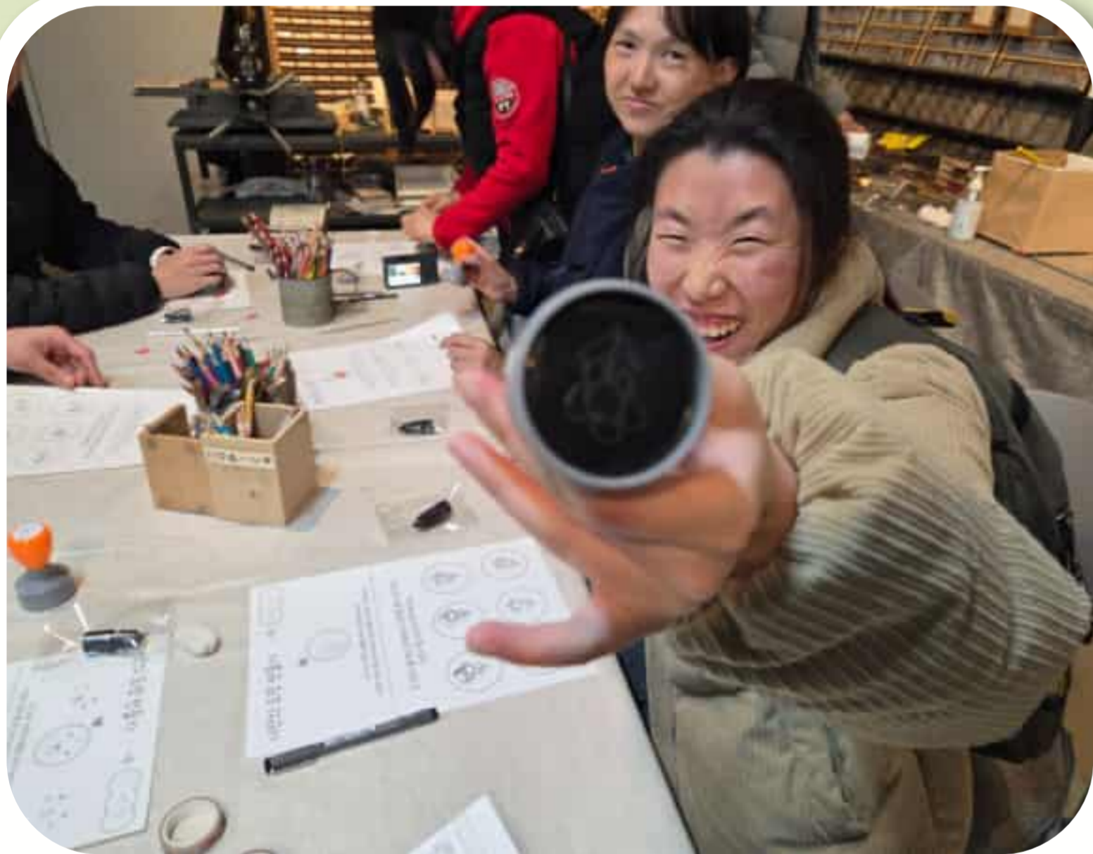
직접 만든 도장을 자랑하는 참여자