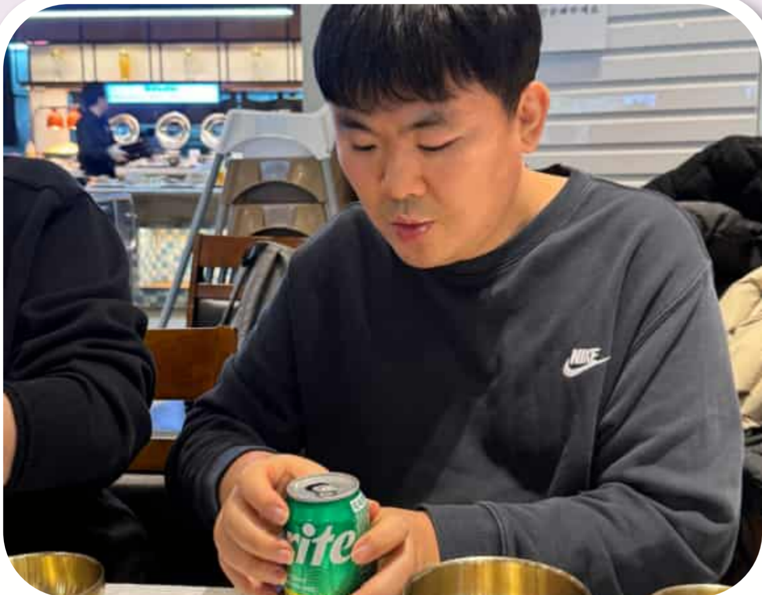
직접 캔을 열어 음료를 드시는 입주자