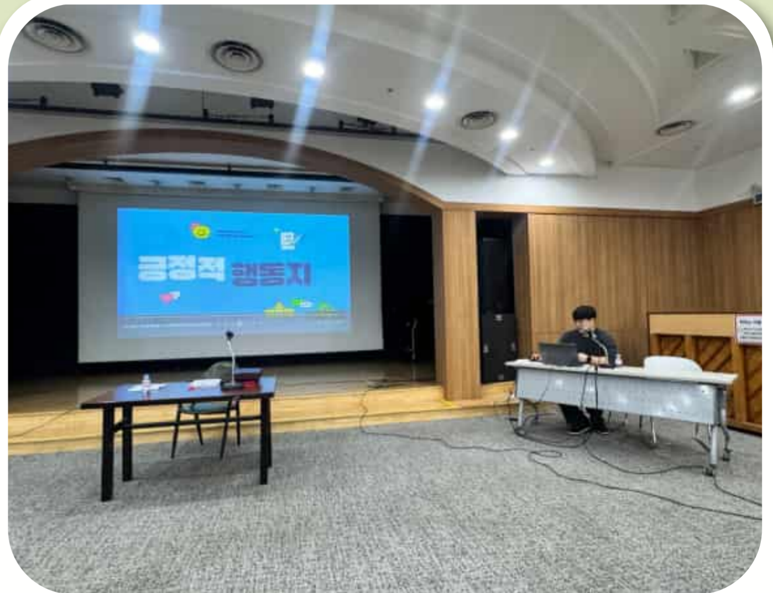
발달장애인 지원 전문교육 진행

2026년 2월 28일 (토) 장애인활동지원사와 이용자가 함께 참여하는 통합교육을 실시하였습니다. 이번 교육을 통해 활동지원 서비스에 대한 이해를 높이고, 현장에서 올바른 서비스 제공 기준을 공유하였습니다.