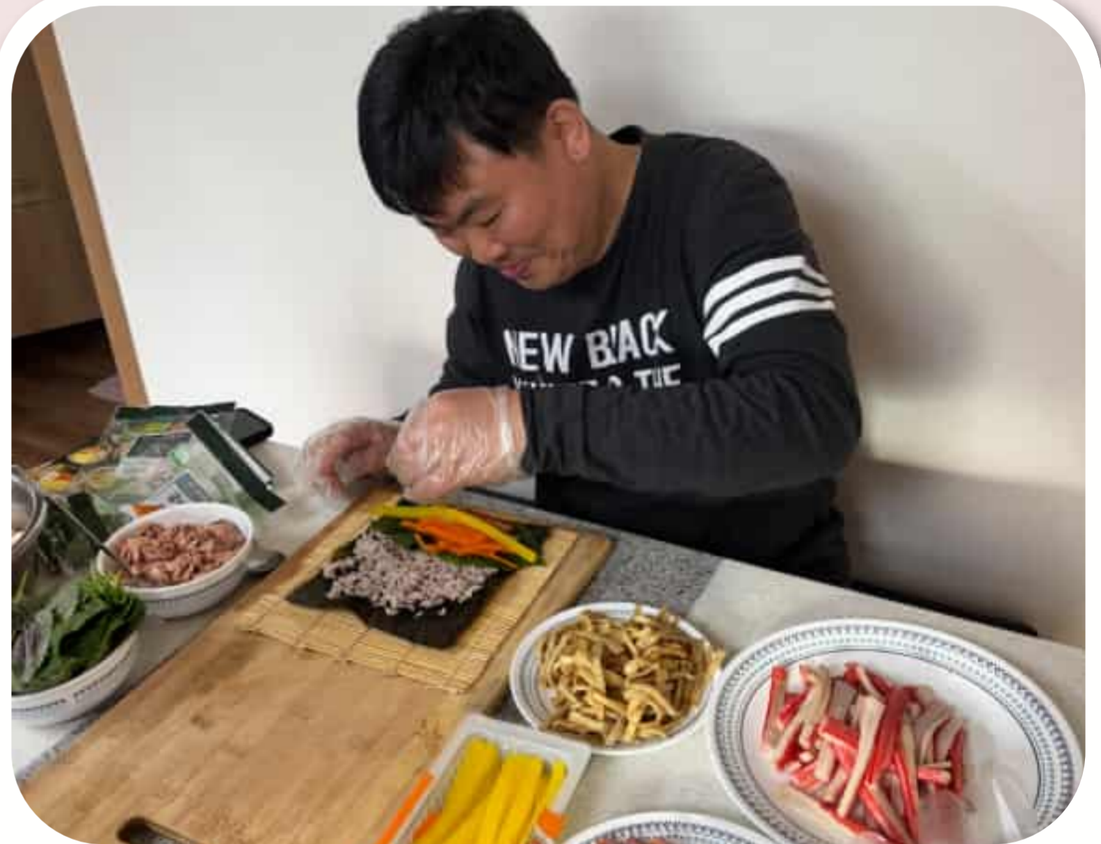
김 위에 재료를 올려놓는 입주자

2026년 3월 24일 (화) 개별자립지원 프로그램으로 요리실습을 진행하였습니다. 입주자 스스로 요리를 직접 만들어 봄으로 '스스로 할 수 있다.' 라는 자신감과 일상생활에 필요한 자립역량 향상을 지원하였습니다.