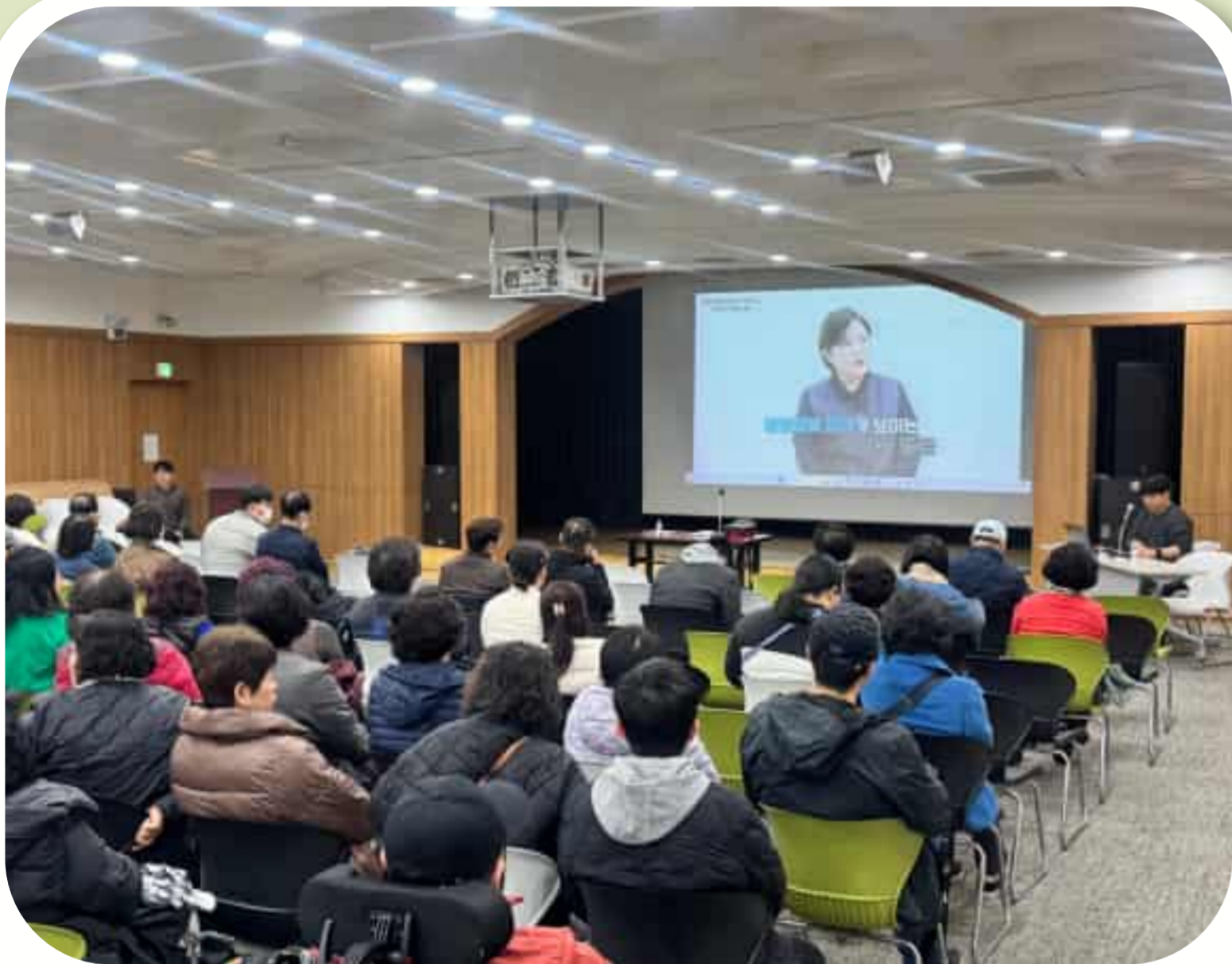
장애인활동지원사 교육 모습