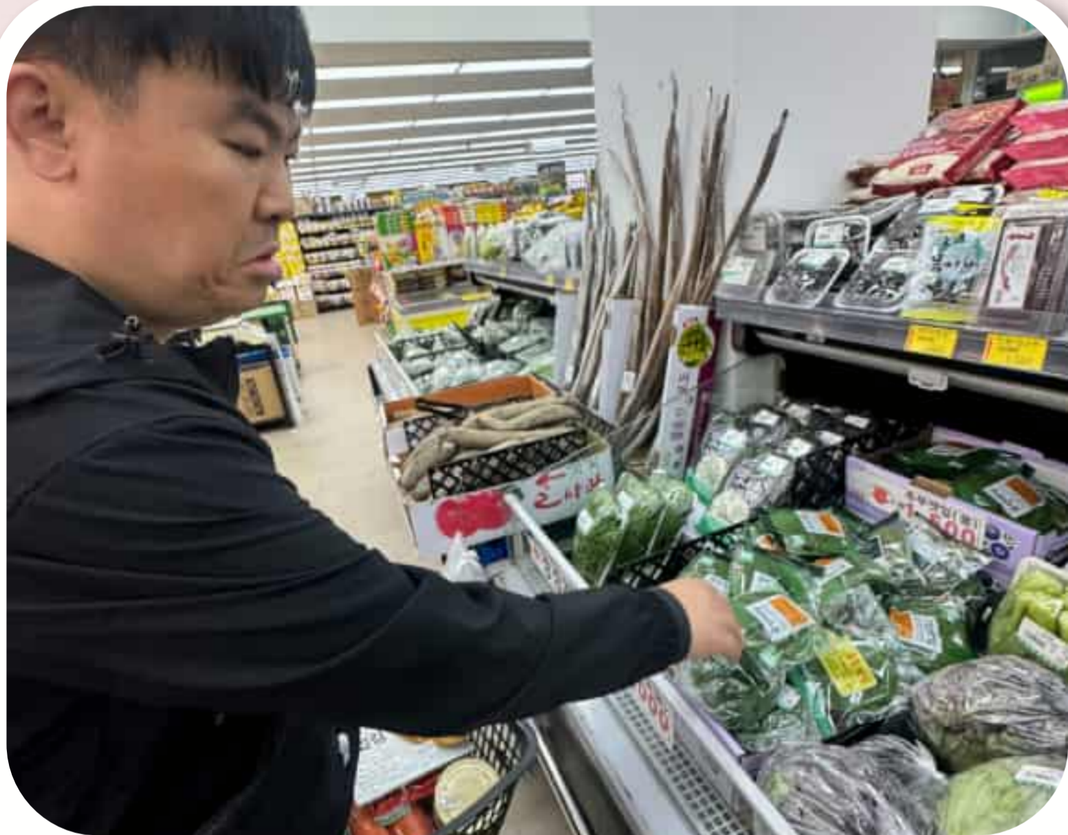
장보기를 하는 입주자