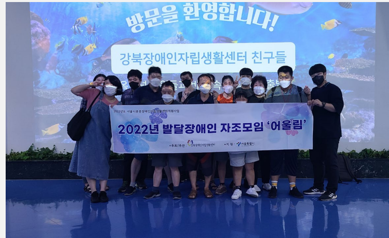
▲ 발달장애인 자조모임 '어울림' 단체사진

8월 18일(수) 발달장애인 자조모임 ‘어울림’ 코엑스 아쿠아리움을 관람했습니다.