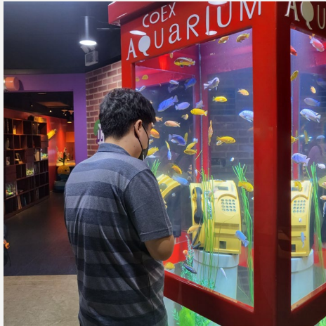
▲ 공중전화 박스 안에 물고기가!~