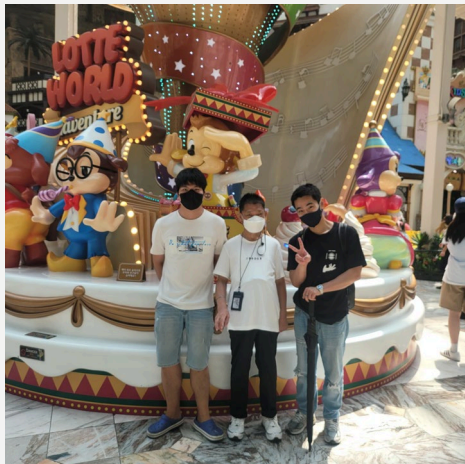
▲ 롯데월드 상징물 앞에서 다함께 찰칵