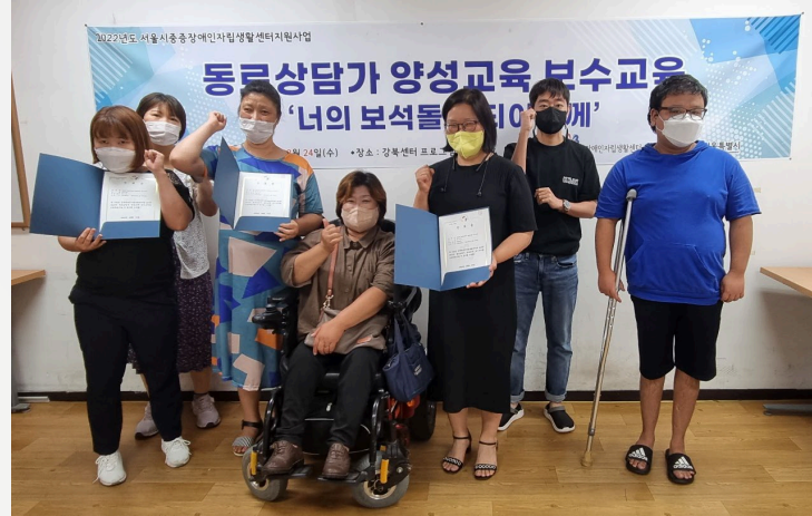
▲ 동료상담가 양성교육 보수교육 단체사진

8월 23일(화) ~ 24일(수) 동료상담가 양성교육 보수교육 '너의 보석돌이 되어줄게' 를 진행하였습니다.