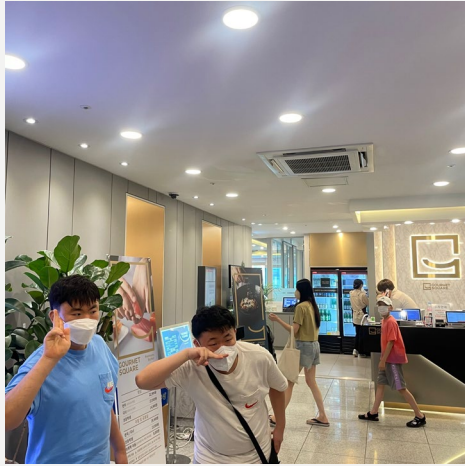
▲ 고메스퀘어 앞에서 즐겁게 찰칵