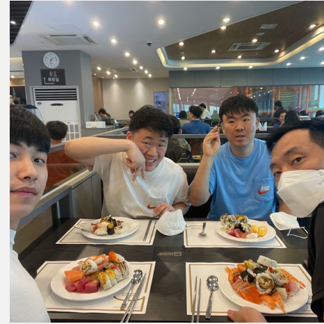
▲ 맛있는 음식을 담은 후 다함께

8월 10일(수) 다형주택 입주자 분들과 맛집 탐방 프로그램을 진행하였습니다.