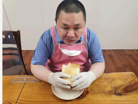
▲ 오○천 어르신 토스트 만들기