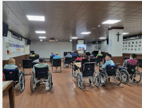
▲ 거주시설 거주인 인권교육

거주시설연계사업의 경우 코로나19가 재유행함에 따라 다시 실내프로그램으로 전환하여 진행하게 되었습니다. 외부활동을 시작한지 얼마 안됐는데 다시 통제됨에 따라 아쉬운 마음이 크다고 하셨습니다.