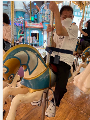
▲ 즐거운 놀이공원 체험 중입니다~