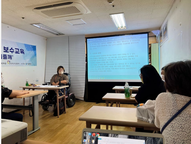
▲ 강사님과 함께 동료상담 실습