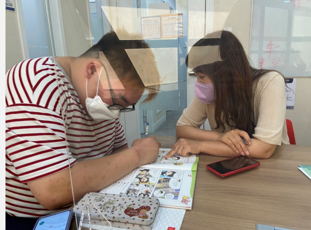
▲ 만화를 보며 배워볼까요?

04월 04일(월)부터 05월 30일(월)까지 1차 ~ 16차 중국어 회화 기초과정을 진행했습니다.