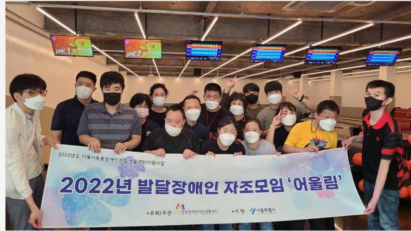
▲ 볼링장에서 단체사진

05월 18일(수) 발달장애인 자조모임 ‘어울림’ 4차 볼링 체험은 수유에 위치한 ‘더블유 볼링장’ 에서 진행되었습니다.