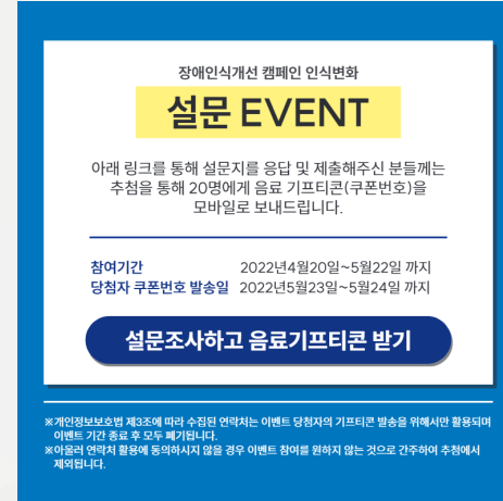
▲ 1차 장애인식개선캠페인 카드뉴스 이벤트 진행

04월 20일(수) ~ 5월 22일(일)까지 제 1차 장애인식개선캠페인 ‘장애인들이 출퇴근시간에 시위하는 이유’ 에 대한 카드뉴스를 발행했습니다.