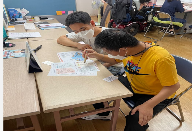
▲ 모의투표를 진행해보는 신○○ 입주자님

05월 25일(수) 장애인자립생활주택 입주자 역량강화교육의 일환으로 장애인참정권 강화 투표교육을 진행 하였습니다.