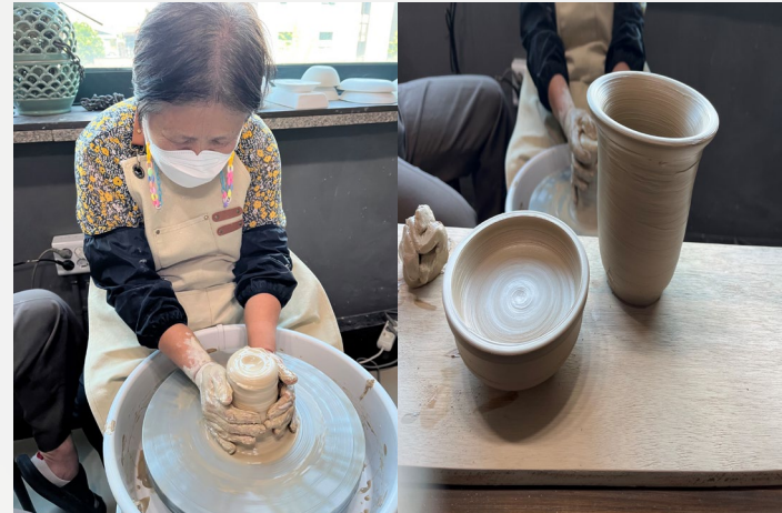
▲ 허○○어르신 ‘화분 만들기’

이처럼 외부 활동이 가능해지면서 모든 어르신이 따스한 햇살을 맞으시며 산책도 하시고 즐거운 프로그램도 진행하셨습니다.