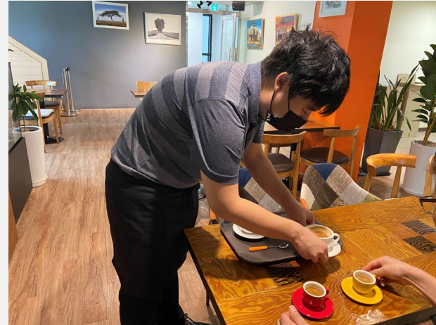
▲ 손님에게 커피를 드리는 연습 중입니다.

04월 05일(화)부터 05월 19일(목)까지 1차 ~ 12차 바리스타2급 자격증 과정을 진행했습니다.