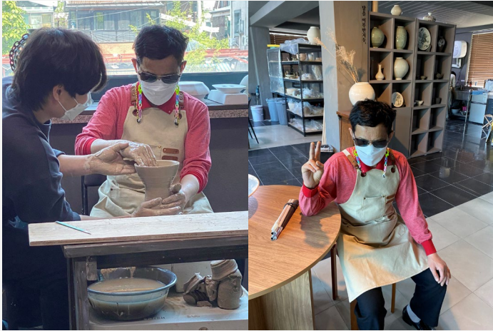
▲ 김○○어르신 ‘도자기 만들기’