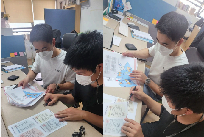
▲ 이○○ 입주자님의 투표교육 진행 모습