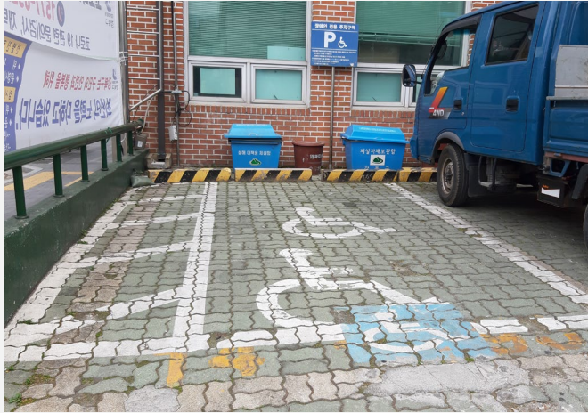
▲ 노후화된 장애인 주차장