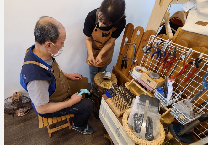
▲ 유○○어르신 ‘은 목걸이 만들기’

5월 거주시설연계사업 3차 개별ILP는 어르신들의 개별욕구에 맞춰 프로그램을 진행했습니다.