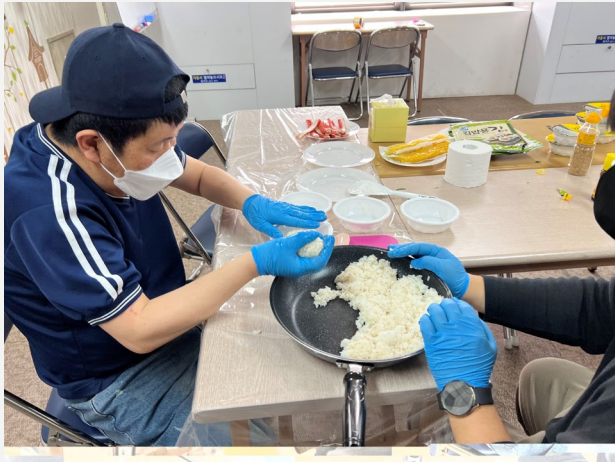
▲ 이○○어르신 ‘소고기 김밥만들기’

이○○어르신은 음식을 좋아하셔서 05월 19일(목) 요리체험으로 소고기 김밥 만들기를 진행했는데요.