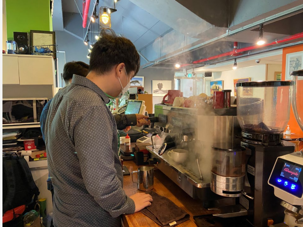
▲ 커피를 추출하기 전 스팀 청소는 필수!