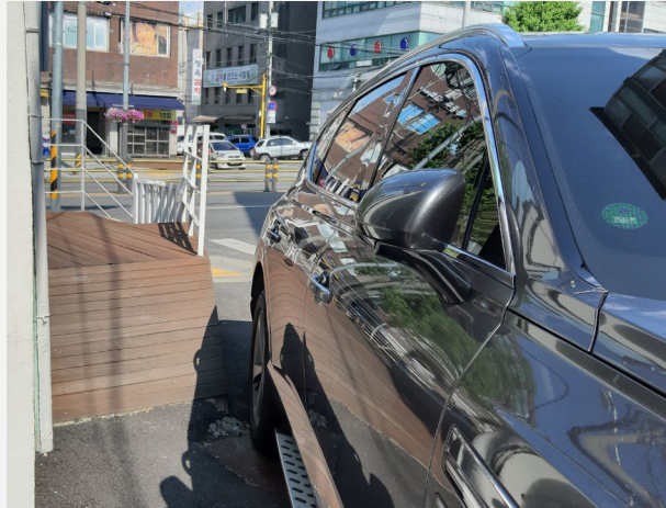
▲ 옆문에 설치되어 있는 협소하고 가파른 경사로 모습