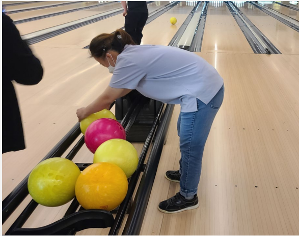
▲ 저에게 맞는 볼링공을 찾아요!