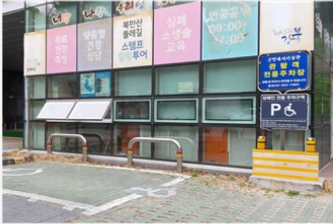
▲ 표준규격(크기)과 맞지 않는 장애인 주차장