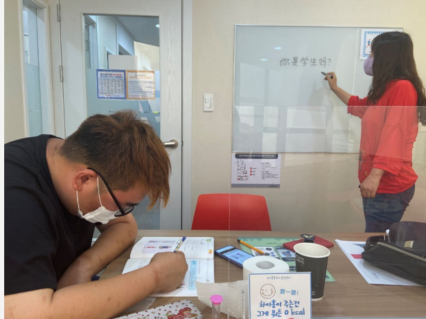
▲ 문장 쓰기 연습 시작!