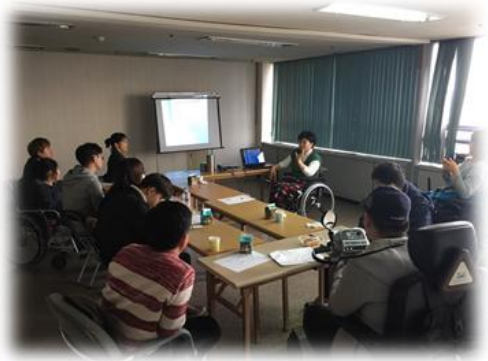
상반기 집단동료상담 진행현장

그 첫 시작으로 3월 21일에 있었던 '상반기 집단동료상담' 프로그램을 진행하였습니다. 강사님, 보조 강사님을 비롯한 집단동료상담 프로그램에 참여하신 분들이 보다 편안하고 접근성에 제한 없이 오롯이 집단동료상담에 집중하는 모습을 보면서 강북센터