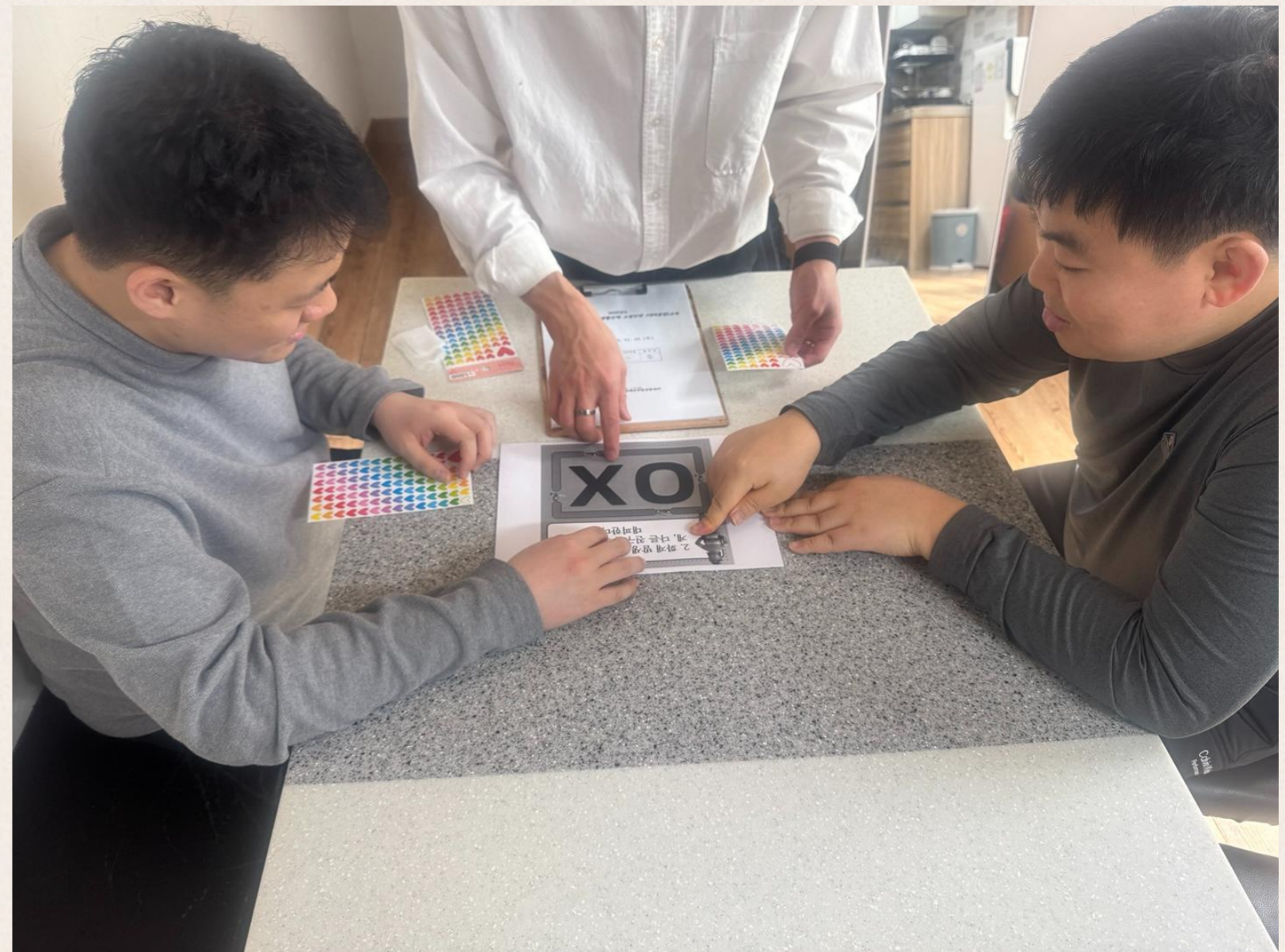
▲ 엄○희님 생일 케이크 커팅식 진행 모습

위 O,X 퀴즈의 답은 무엇이라 생각하십니까. 작년 강북소방서 담당관으로부터 들었던 의견에 비추어 볼 때, 주택 구조와 입주자분들의 장애 정도를 고려할 때 몸을 웅크리는 것보다 그냥 신속하게 주택을 빠져나가는 것이 훨씬 안전하다는 의견을 주었습니다.