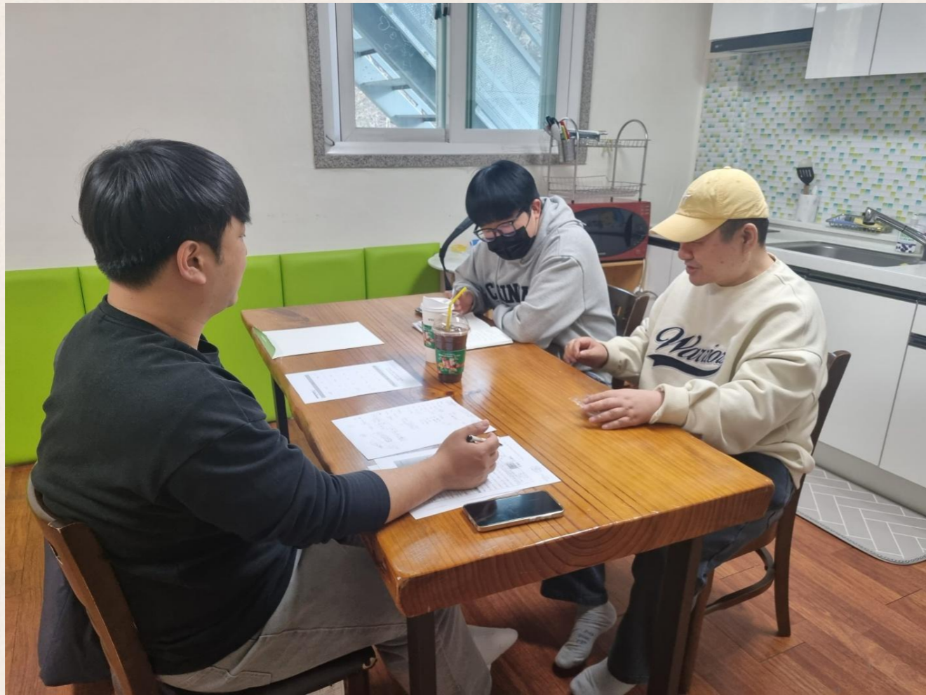
▲ 오○천님 어떤 서비스를 원하시나요?