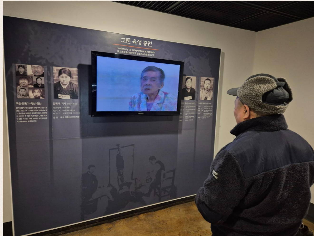
▲ 서대문형무소역사관 증언을 듣는 오○천님