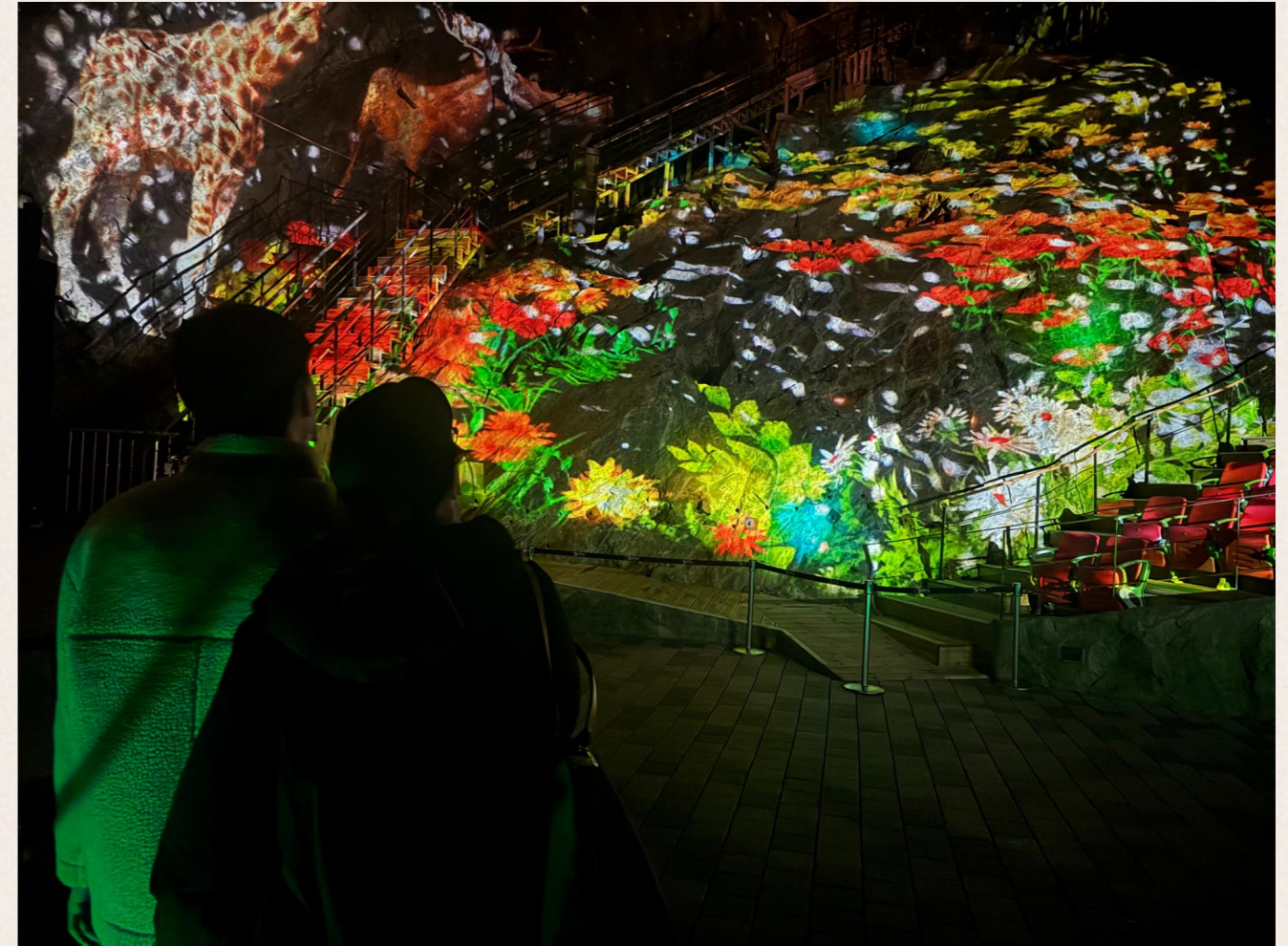
▲ 레이저쇼를 관람하는 김○환님

2025년 자조모임 두번째 프로그램으로는 문화유산 체험 - 광명동굴이 진행되었습니다. 사전회의부터 놀이공원, 동물원, 동굴 등이 나오며 외부활동에 대한 큰 욕구를 보여주셨습니다. 광명동굴은 경기도 광명시에 위치하고 있어 사당역에 집합 후 맛있는 햄버거로 점심식사를 진행하고 택시를 통해 체험 진행장소로 이동하였습니다. 광명동굴 내부에 다양한 조형물과 역사적 기록물이 비치되어 있고 레이저쇼도 관람할 수 있어 참여자 모두가 흥미로운 체험이 될 수 있었으나 광명동굴이 과거 광산으로 이용됐던 터라 계단이 많아 힘들었는 평가도 나타났습니다.