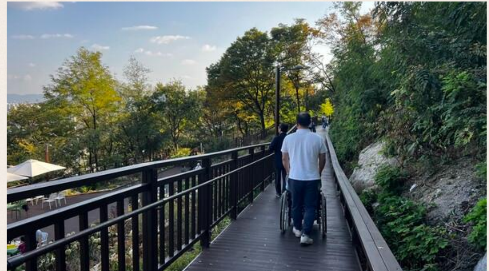
▲ 개운산 무장애숲길

이로써 오는 연말이면 서울에는 총 76.16km의 무장애숲길이 조성돼 운영될 예정이다.