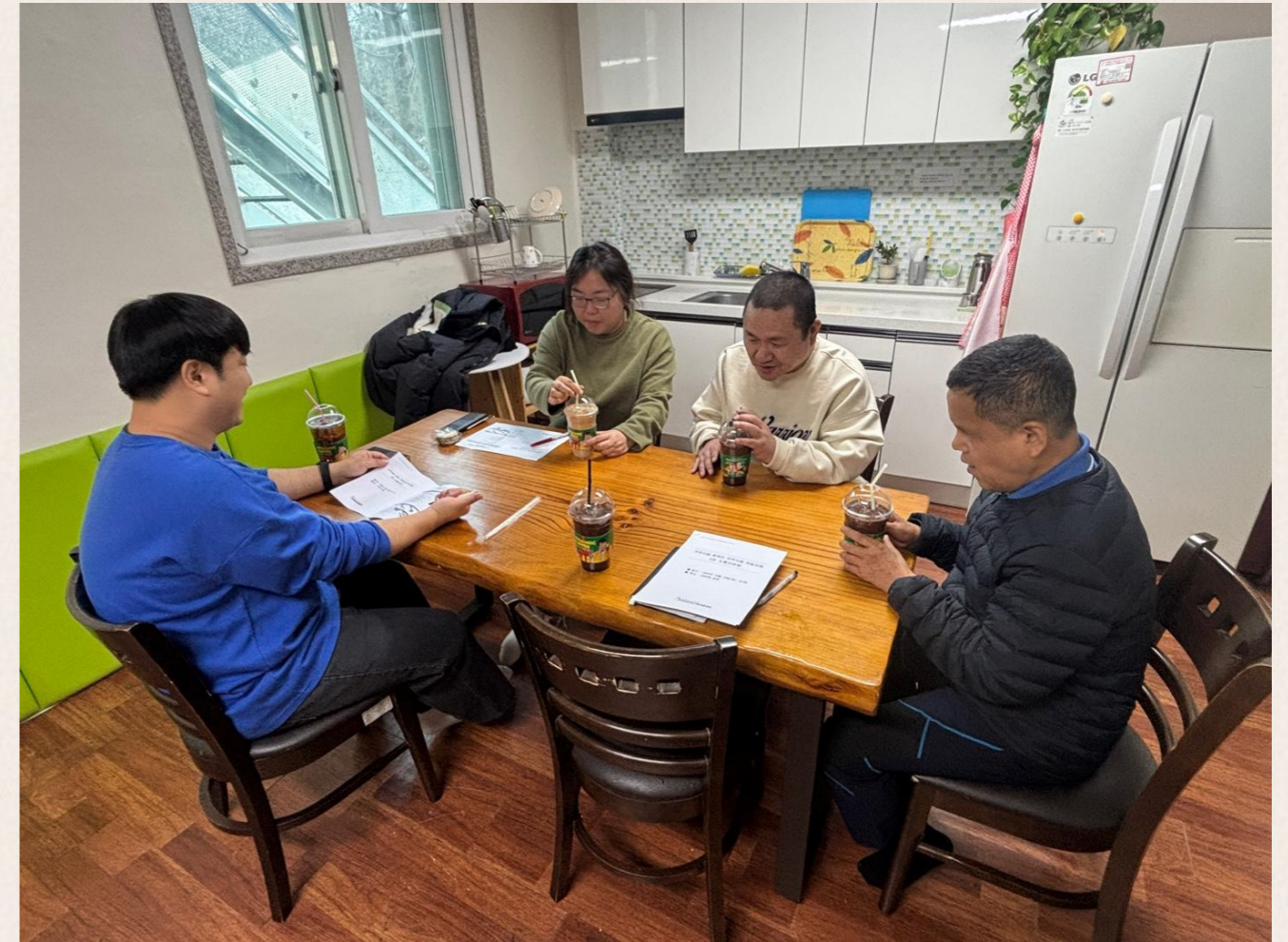
▲ 거주시설 장애인 소통간담회 진행 모습

이번 간담회에서는 인권교육, 개별·집단 ILP, 욕구 서비스 조사, 자립생활 체험 등 다양한 프로그램에 대한 참여자들의 솔직한 의견이 오갔습니다.