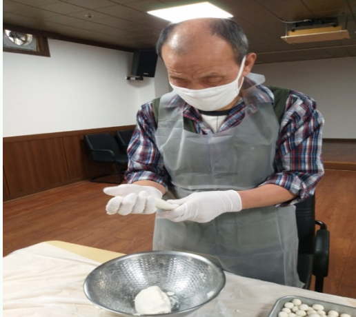
▲ 새알심 만들기 유○○어르신