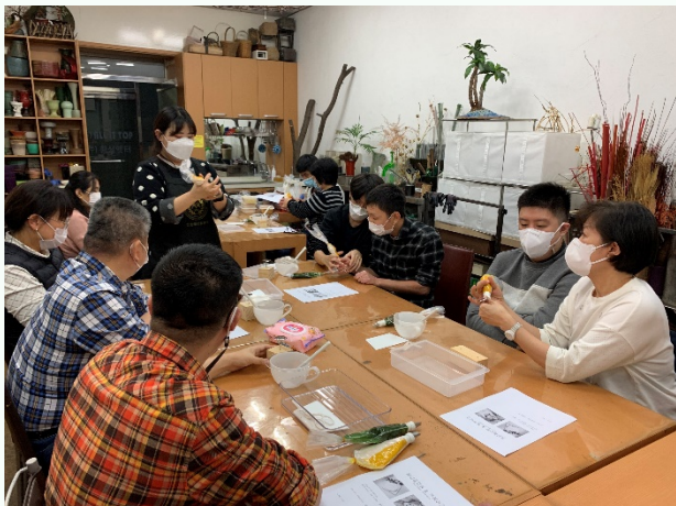
▲ 떡 공예를 위해 찰주머니를 준비하는 모습