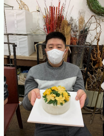
▲ 자신이 만든 떡을 자랑하며 한 컷~!

떡 공예체험은 강북센터 건물 지하 1층에 위치한 문화센터에서 진행되었으며 강사님의 설명을 듣고 서툴지만 열심히 앙금플라워를 만들어 보았습니다. 섬세함을 요하는 작업이기 때문에 만드는 것이 쉽지 않았지만 그래도 여러 개 만들다 보니 점점 예쁜 꽃의 형태를 갖추었습니다.