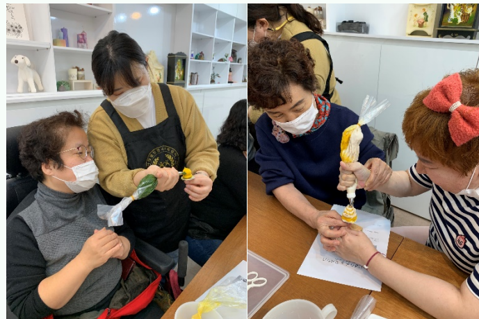
▲ 자신이 원하는 예쁜 모양을 직접 만드는 모습

10월 30일(금) / 11월 02일(월) 4차 집단자립생활기술훈련 떡 공예 - 양금플라워케이크 만들기가 진행되었습니다.