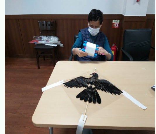
▲ 연 만들기 김○○어르신

11월 개별 ILP 역시 참여자들 1:1 욕구를 반영하여 프로그램을 계획 및 수립하였습니다. 전반적으로 요리교실을 선호하는 참여자들이 많은 편으로 11월에는 새알심 만들기, 과일사라다 만들기, 연 만들기 등으로 진행되었습니다.