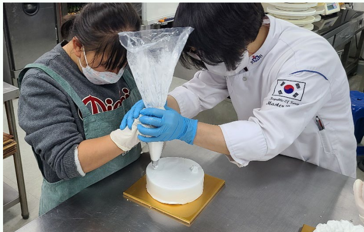
▲ 케이크 위에 예쁜 모양을 내는 모습