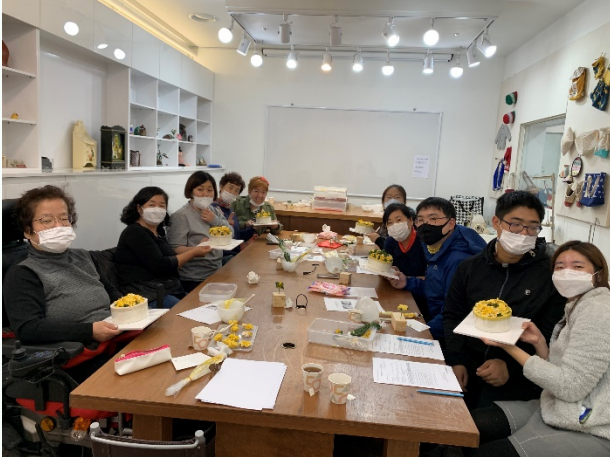
▲ 자신이 직접 만든 떡과 함께 단체사진 찰칵