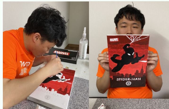
▲ 참 잘 그렸죠?(입주자 강○○씨)

11월 17일(화) 다형 장애인자립생활주택 여가·문화체험프로그램이 있었습니다.