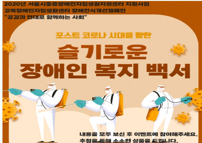
▲ 6차 장애인식개선캠페인 카드뉴스