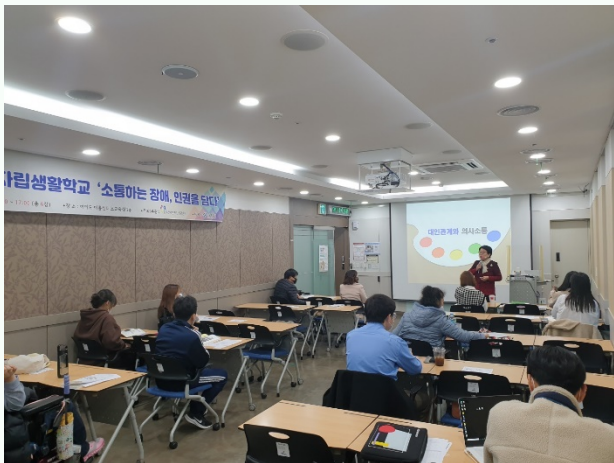
▲ 5강 '의사소통과 대인관계'