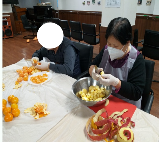
▲ 과일사라다 만들기 허○○어르신