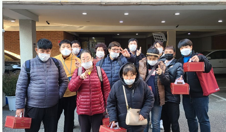
▲ 다 함께 케이크를 들고 즐겁게 사진을 찍는 모습

발달장애인 자조모임 제과제빵 체험을 위해 11월 11일(수) 13시에 가든타워 1707호에 모여 체온과 손 소독 진행 후 먹고 싶었던 떡볶이, 컵밥, 튀김을 먹고 분리수거를 진행을 마친 후 마스크 착용을 확인 후 노원역으로 이동하였습니다.