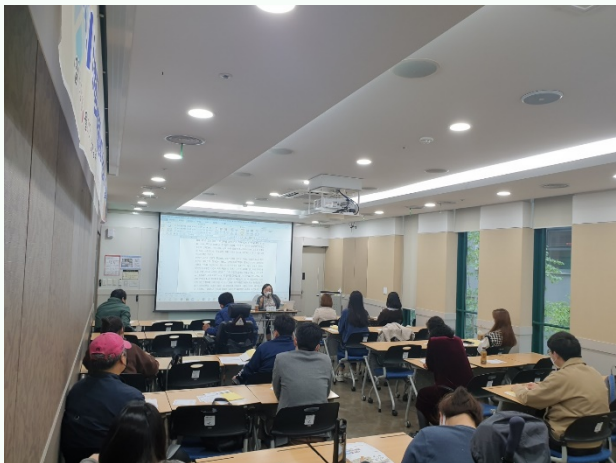
▲ 3강 '장애학과 당사자주의'