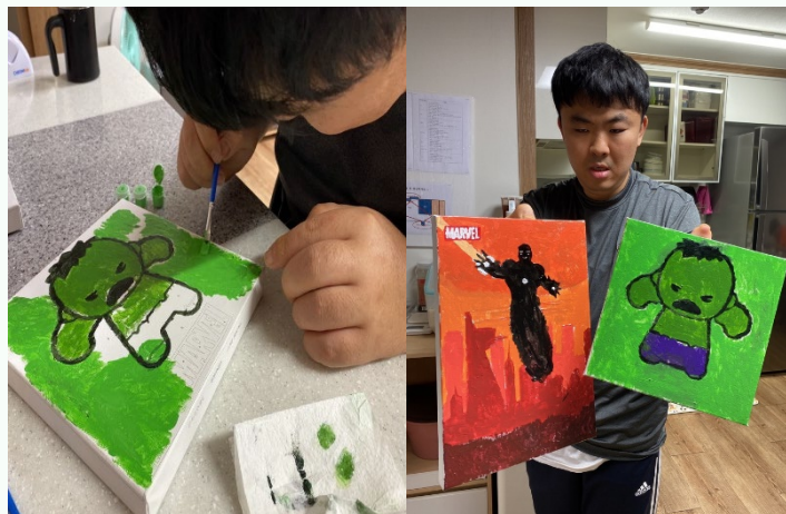
▲ 자신이 직접 그린 그림 자랑해보요!(입주자 엄○○씨)