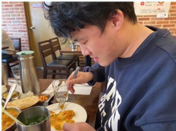
▲ 외식문화체험 인도음식 커리