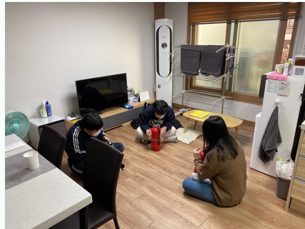
▲ 소화기 사용법 어렵지 않아요

12월 03일(목) 다형 장애인자립생활주택 소방안전교육을 진행하였습니다.