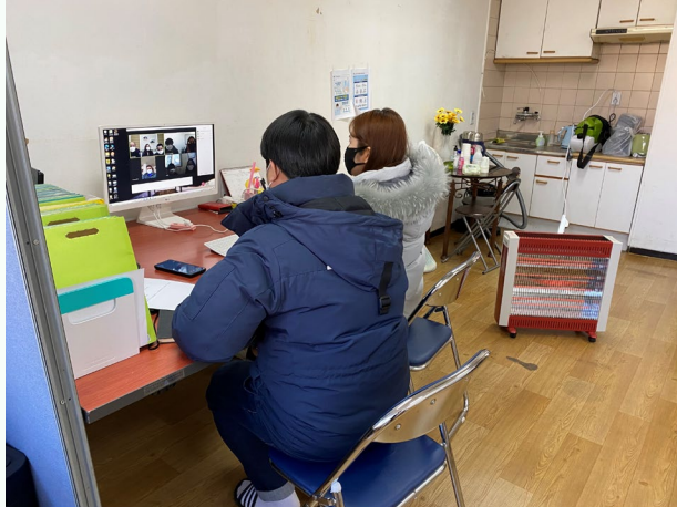
▲ 거주시설장애인 탈시설 자립지원 평가회 진행 모습