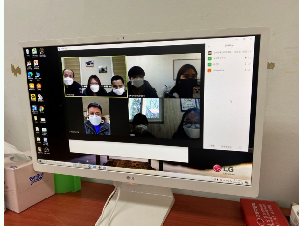
▲ ZOOM 화상회의 진행 모습

대부분 대면 중심의 서비스 및 프로그램으로 계획을 수립하였으나 전면 비대면으로 전환되면서 프로그램 운영경험 미흡 등으로 많은 한계를 겪기도 하였으나 시설 측 담당자분들께서 많은 도움을 주셔서 잘 마무리할 수 있었습니다.