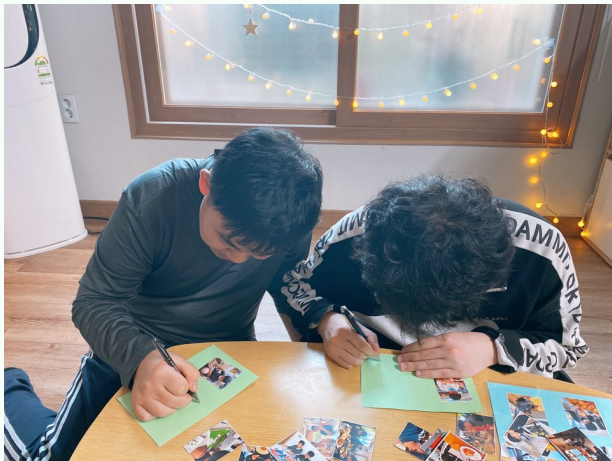
▲ 사진을 붙이며 크리스마스 카드를 만들어요!