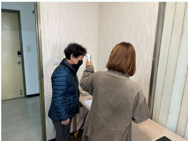
▲ 참여자들의 체온을 재는 모습