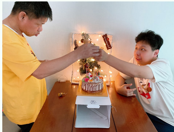
▲ 완성된 크리스마스 케이크 앞에서 신나는 파티!

12월 24일(목) 크리스마스를 앞두고 가형 주택의 여가문화 체험으로 크리스마스 파티가 진행 되었습니다.