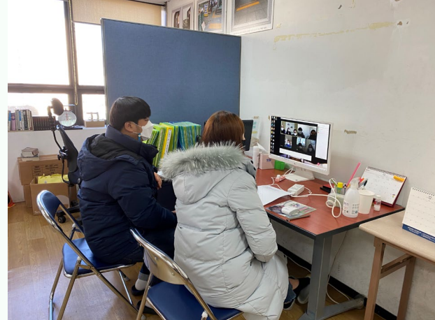
▲ 사업 추진실적과 평가를 공유하는 모습

12월 15일(화) 2020년 거주시설장애인 탈시설 자립지원 평가회를 진행하였습니다.