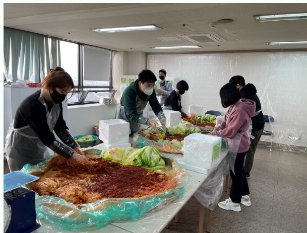
▲ 하반기 체험 김치 담그기 진행 모습

11월 27일(금) 강북센터에서 하반기 체험 김치 담그기를 진행하였습니다.