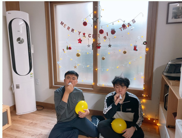
▲ 즐거운 크리스마스 파티 정말 재밌어요!

12월 24일(목) 다형 장애인자립생활주택에서 크리스마스 파티를 진행하였습니다.