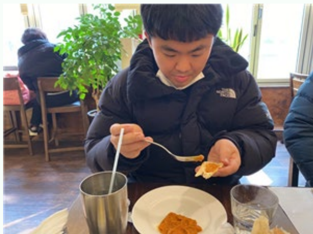
▲ 맛있는 난과 함께 먹어요~

12월 08일(화) 다형 장애인자립생활주택 외식문화체험 프로그램이 있었습니다.