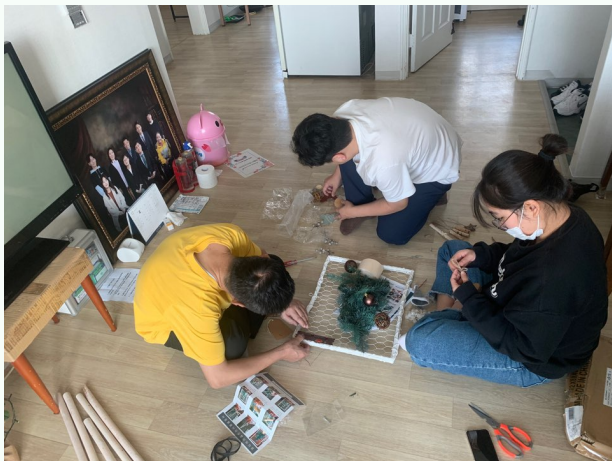
▲ 다함께 크리스마스 트리를 꾸미는 모습