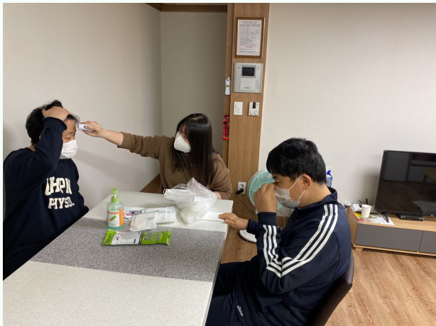
▲ 코로나19 방역수칙 함께 알아봅시다